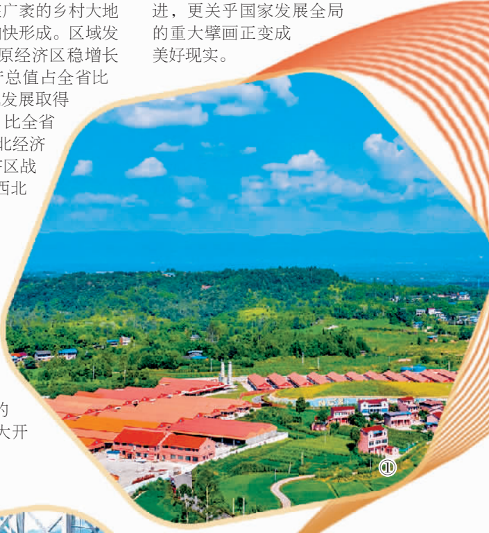
图① 四川广安市石笋镇万头湖羊种羊养殖基地。

据介绍,2021年,四川财政落实种粮大户补贴资金2.49亿元,支持发展粮食适度规模经营,保障农民和经营主体种粮有合理收益。