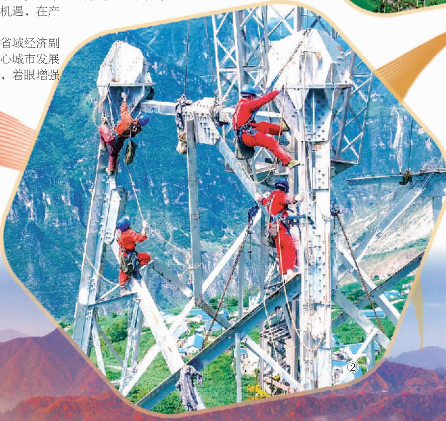
图② 国家“西电东送”战略部署的重点工程——白鹤滩—浙江±800千伏特高压直流线路工程施工现场。