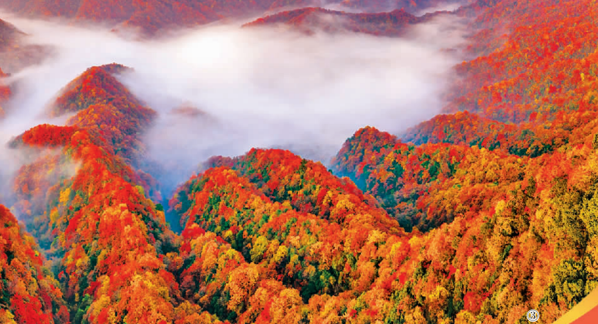
图③ 位于四川巴中市南江县的国家5A级旅游景区光雾山。(资料图片)