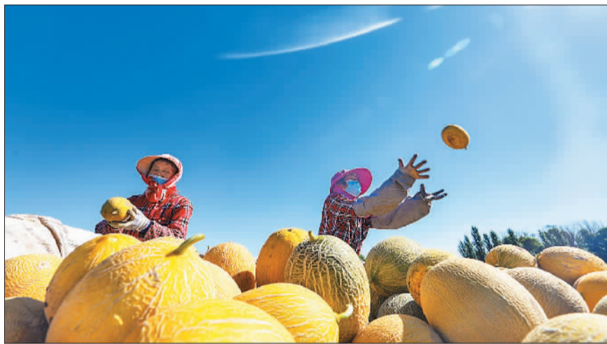
▲新疆呼图壁县固户村镇马场湖村,村民在收获甜瓜。该县积极培育特色产业,引导农民向高效农业发展,助力乡村振兴。