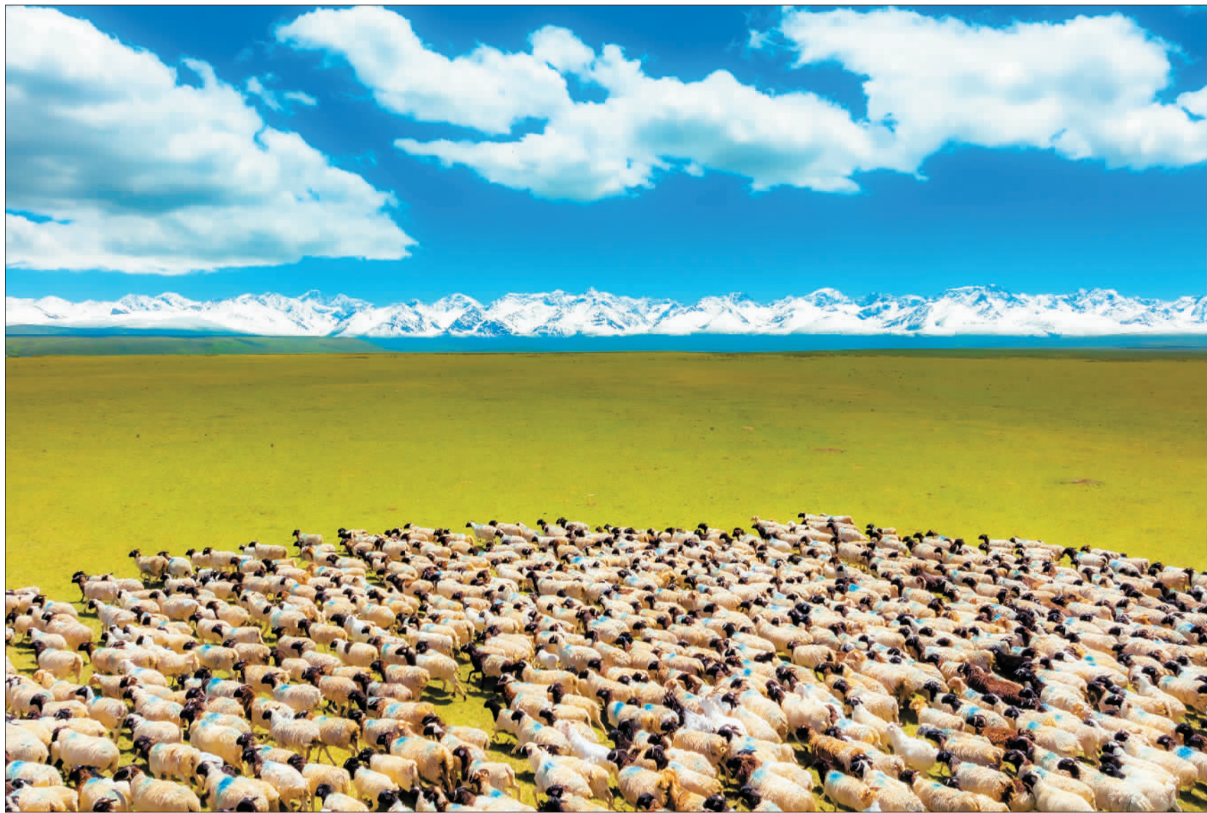
▲景色宜人的新疆巴音布鲁克草原。随着当地生态保护力度的加大,牧场草壮水美,清新秀丽。

除了全景图,“画中画”也格外精彩。“天马之乡”昭苏县机场投运的“马上起飞图”,喀什培育樱桃这一富民金果的“群樱荟萃图”,“枸杞之乡”精河县描绘的“红色产业振兴图”……一幅幅动人的图景,正连缀成一幅振奋人心的崭新画卷。