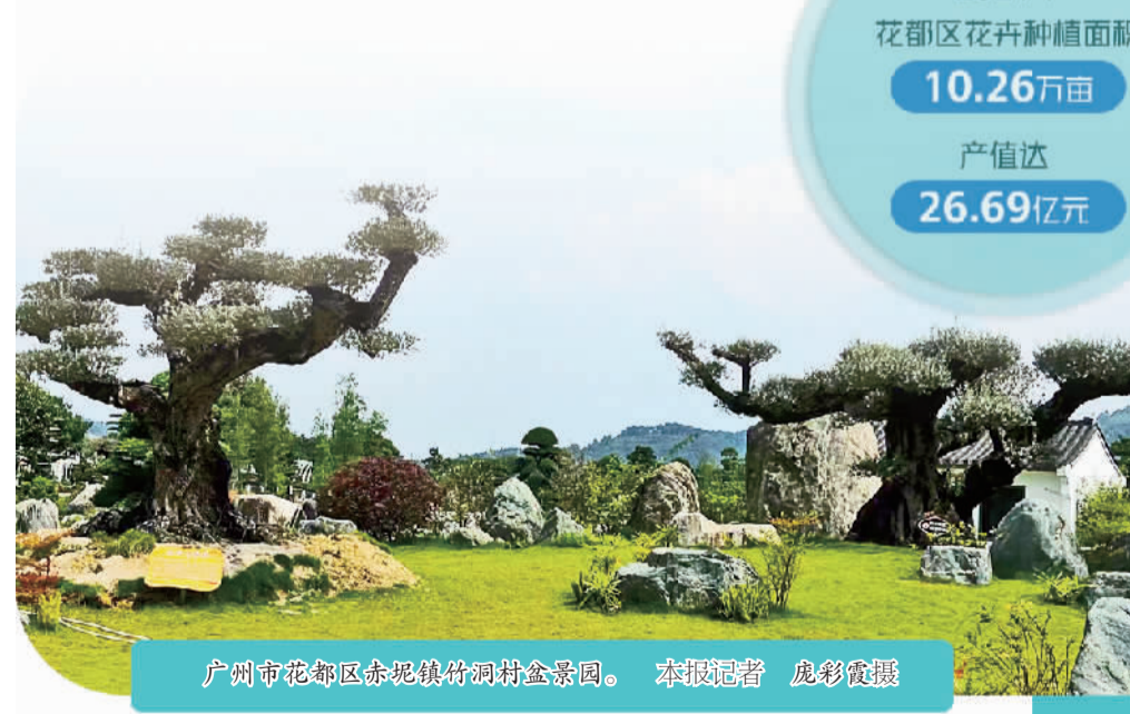
广州市花都区赤坭镇竹洞村盆景园。