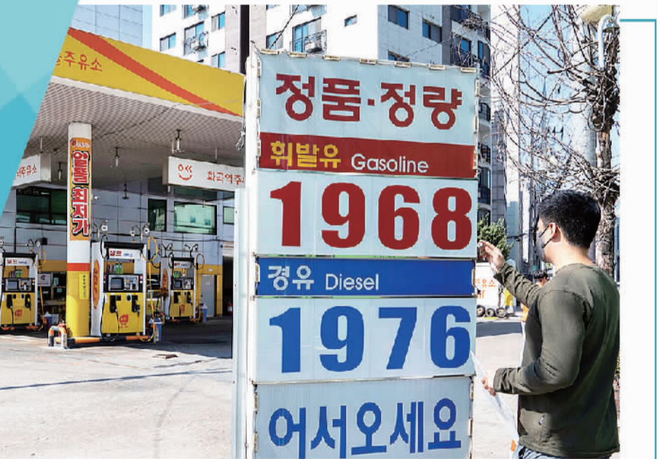
图为5月27日，韩国首尔一家自助式加油站的油价牌。