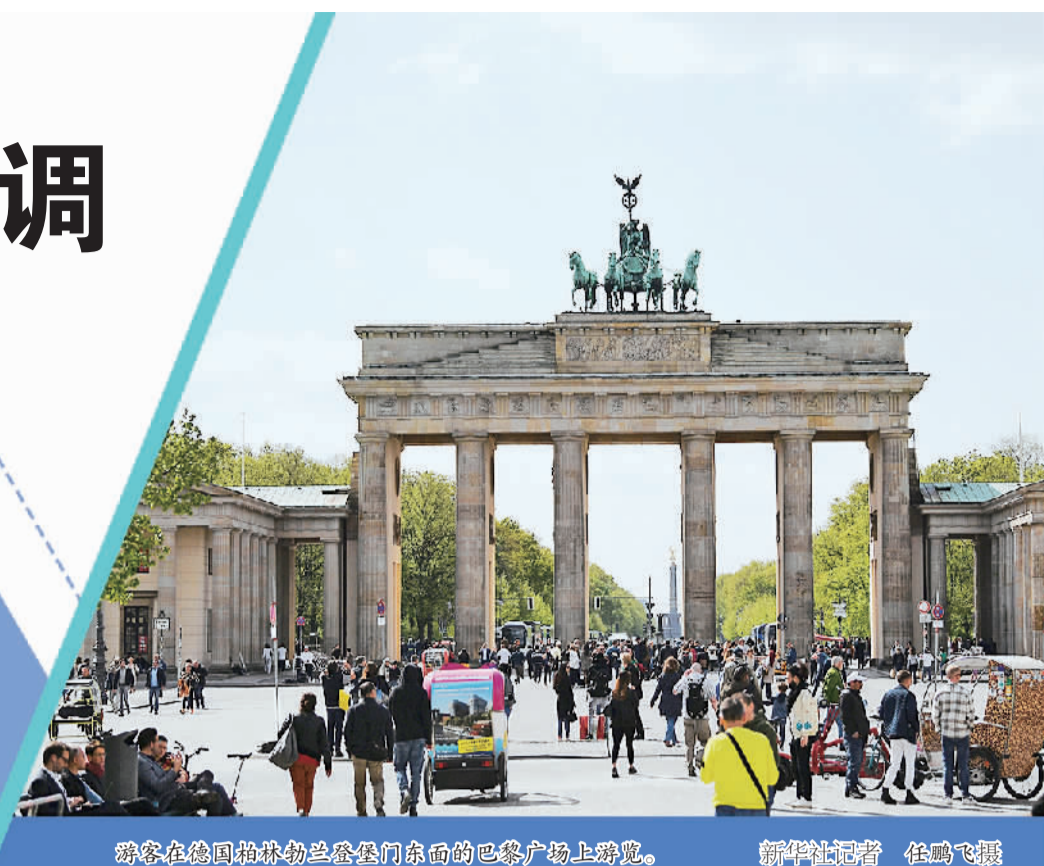
游客在德国柏林勃兰登堡门东面的巴黎广场上游览。