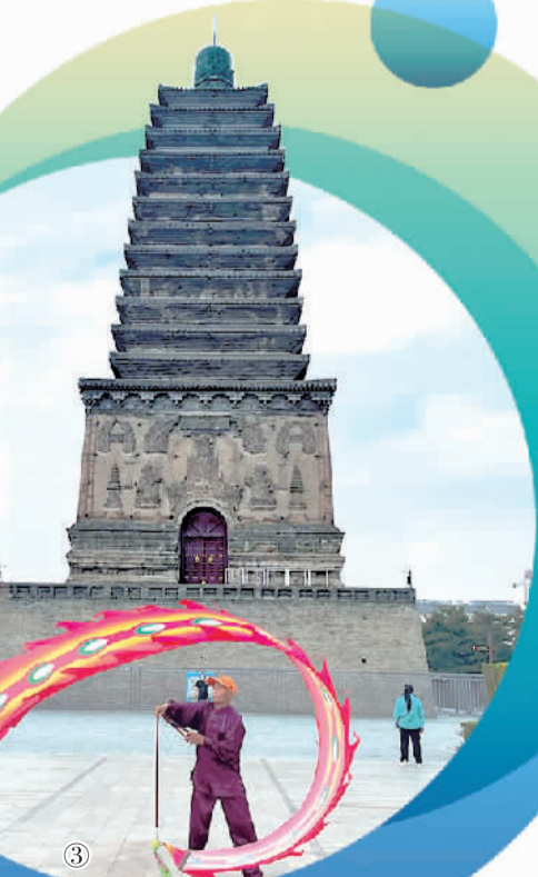
图③ 在辽宁省朝阳市北塔外，文化爱好者在“舞飞龙”。