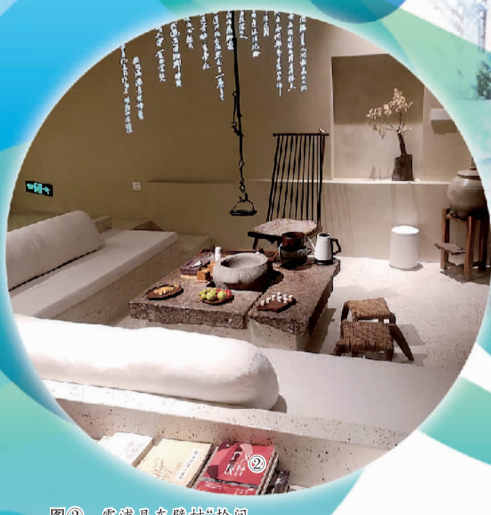
图② 霞浦县东壁村“拾间海”民宿的精美茶室。

在福建东北部的山海之间，坐落着一座宝藏小城霞浦。作为福建省海岸线最长、浅海滩涂面积最广、岛屿最多的沿海县，霞浦县的自然风光和人文景观交相辉映，蜿蜒曲折、岬角突出的海岸线历经千万年的海浪洗礼，天光云影、日升日落塑造出如梦似幻的滩涂画卷。水的灵动、山的雄奇在此交织，无数摄影爱好者纷至沓来。 依托得天独厚的山海资源，霞浦县近年来发挥摄影+民宿、摄影+乡村旅游和历史文化等优势，探索“摄影+民宿”产业发展新路子，激发“网红经济”，点燃乡村振兴新引擎。然而，受当前疫情不断反复的影响，极度依赖客流量量的民宿业正承受着巨大压力，想方设法、努力突围成为霞浦民宿业发展的必然选择。