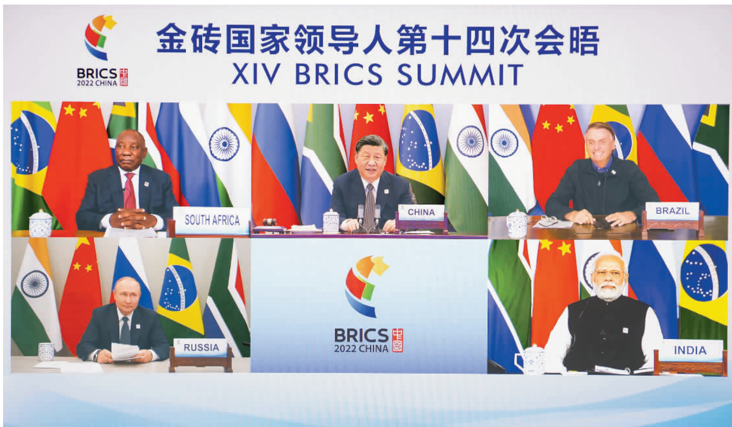
6月23日晚,国家主席习近平在北京以视频方式主持金砖国家领导人第十四次会晤并发表题为《构建高质量伙伴关系 开启金砖合作新征程》的重要讲话。