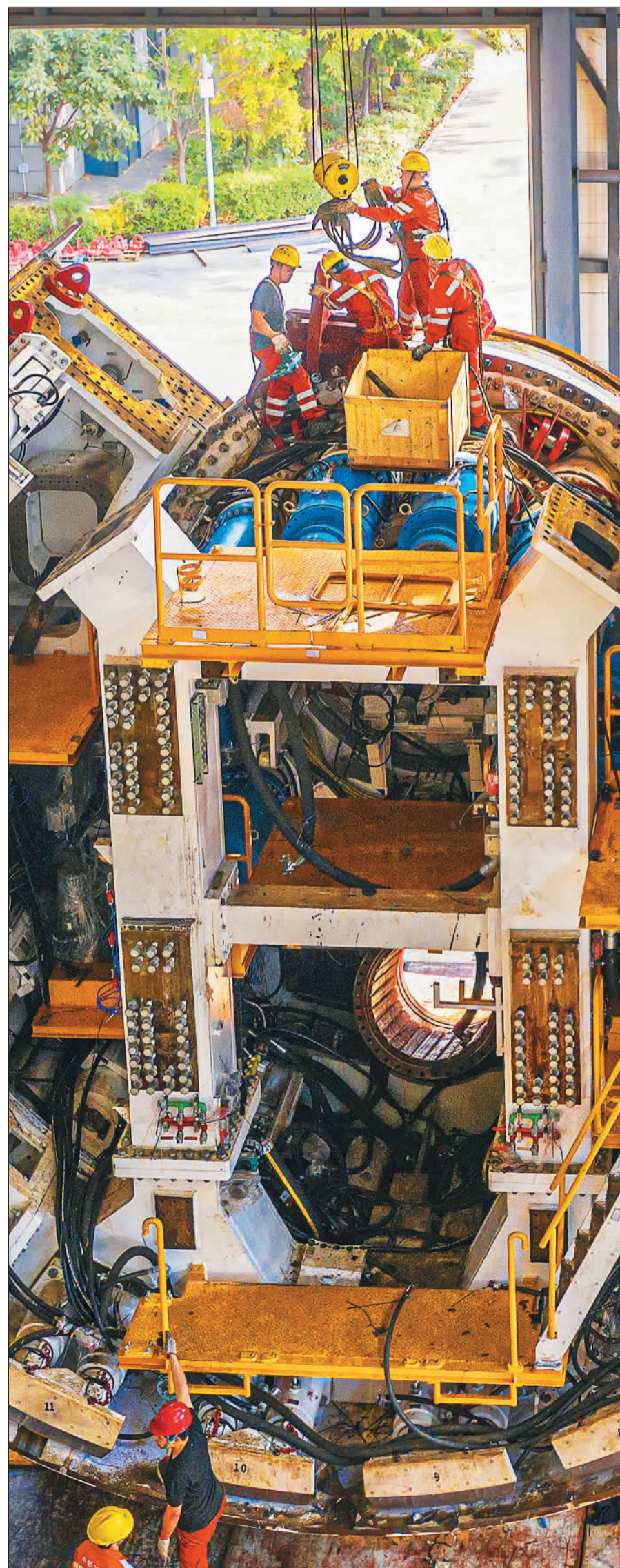
▲内蒙古兴安盟敬业集团乌兰浩特钢铁有限责任公司员工在作业中。该企业充分利用智能化、互联网和5G技术,推动企业发展。