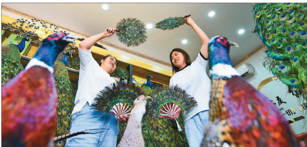
▲山东省阳谷县张秋镇东义和村党支部领办的特色养殖加工合作社,通过“党支部+合作社+返乡创业能人+脱贫户”模式,引导农民发展特色养殖、工艺品加工等产业,助民增收。