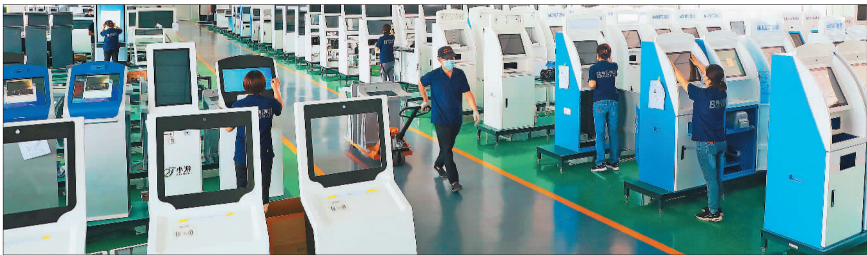
▲河北省易县博视长远智能科技有限公司,员工正在调试智能终端设备。近年来,该县积极构建现代产业体系,大力发展科技型中小企业和高新技术企业,以科技创新为引领,培育行业“小巨人”和“单项冠军”企业。