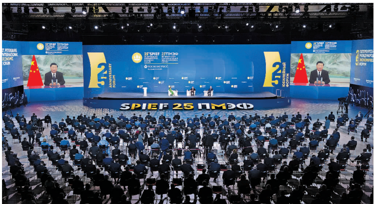
新华社北京6月17日电 6月17日晚,国家主席习近平应邀以视频方式出席第二十五届圣彼得堡国际经济论坛全会并致辞。