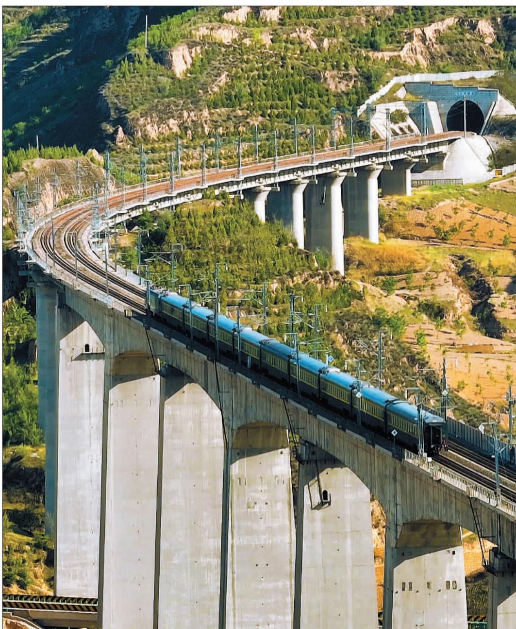
▲位于吕梁市兴县的蔡家崖是红色老区，2018年，扶贫列车开进蔡家崖，为当地经济发展注入强劲动力。