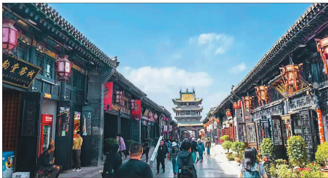
▲作为“保存最为完好的古城”之一，位于晋中市的平遥古城吸引着大量游客前来参观游览。

托，以饱满的精神面貌和高昂的奋进姿态，努力在转型发展上率先蹚出一条新路。转型态势更加强劲、民主法治更加健全、文化自信更加坚定、人民生活更加幸福、生态底色更加靓丽、政治生态更加清明……一个更加美好的山西将持续在高质量发展上取得新突破，奋力谱写全面建设社会主义现代化国家的山西篇章。