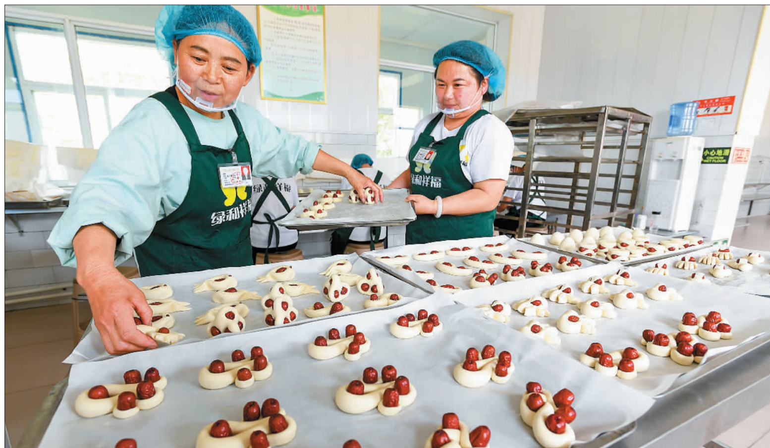
▼临汾市霍州绿和祥食品有限公司员工在加工霍州花馍。花馍寓意吉祥如意，目前已成为霍州一大产业。