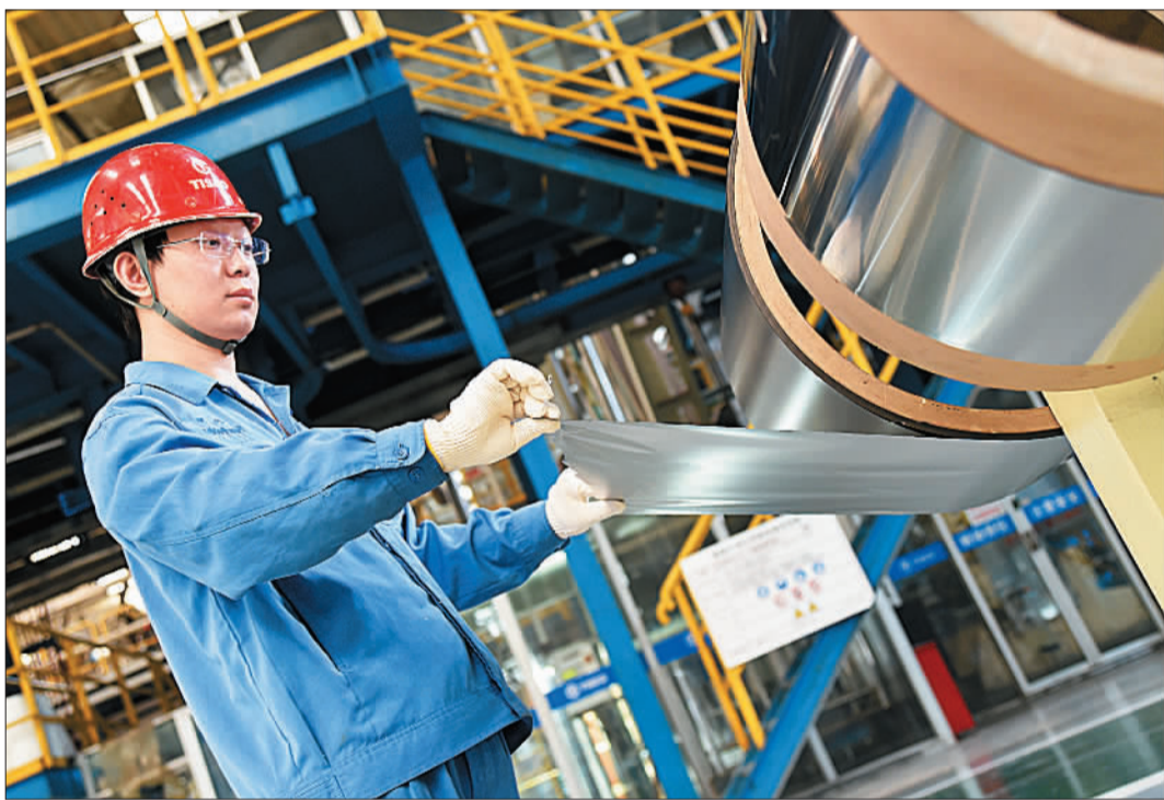
▲中国宝武山西太钢不锈钢精密带钢公司员工在展示“手撕钢”。