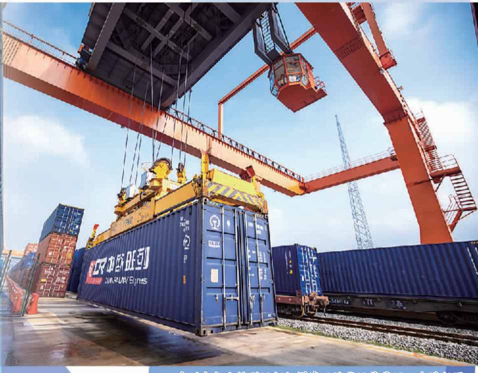
广州东部公铁联运枢纽增城西站货运装车区正在进行国际班列龙门吊吊装作业。

为打好“大上海保卫战”作出积极贡献。同时做好重点企业的铁路运输服务保障,及时了解原材料和成品运输需求,精细制定铁路运输方案,助力企业复工复产、提质增效,为疫后发展积蓄力量。