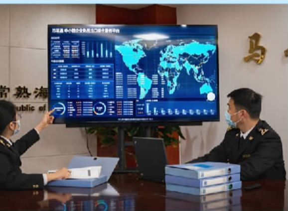
南京海关关员通过“市采通”平台对市场采购贸易进出口情况进行监测。