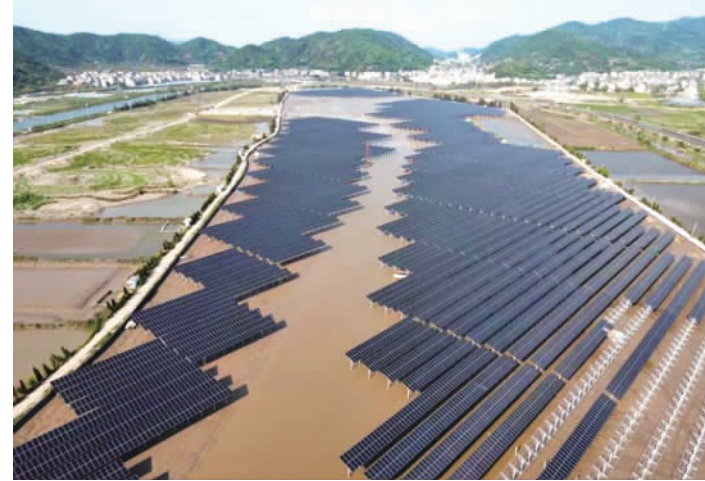
图为全国首座湖光互补型智能光伏电站——国家能源集团龙源浙江温岭湖光互补型智能光伏电站。(资料图片)

如安徽省宿州市加强企业信用考核和应用,分类降低预售资金监管留存比例。 值得注意的是,商品房预售资金监管的底线仍是确保房地产开发项目的按时交付,更大程度维护购房者合法权益。预售资金监管规范化应使得预售资金真正实现从拿地开发到销售回款直至交房的全流程管控、全周期监管。 优化商品房预售资金监管并不是通过合理释放资金过度刺激房地产投资或消费,强化监管也不能控制或遏制房地产发展,进一步优化商品房预售资金监管,应有利于促进房地产市场健康发展,使商品房预售资金的治理方式更加现代化,更符合市场规律。