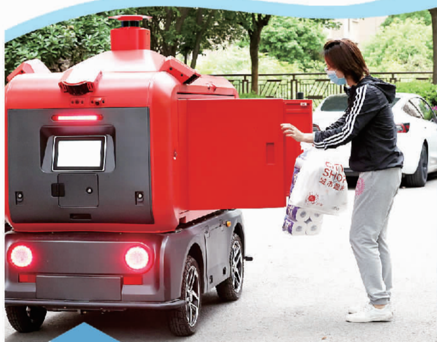
上海市嘉定区南翔镇一小区的居民从智能快递车上取货。

记者采访了解到,由于快递行业复工复产涉及链条长,受上游平台、干线运输和末端网点恢复情况不一等多重因素影响,行业复工复产仍存在一些难点。比如,部分地区一线复工人员仍在逐步到岗中,人手不足,派件、揽收面临不小挑战;个别区域疫情管控升级,无法进行最后一公里配送,需要库存区存储配送滞留的货物,导致末端网点有较大压力。