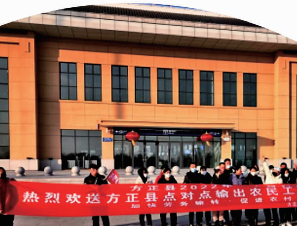
图① 今年春节过后,黑龙江省方正县协调列车“包厢”护送农民工返岗就业。(资料图片)