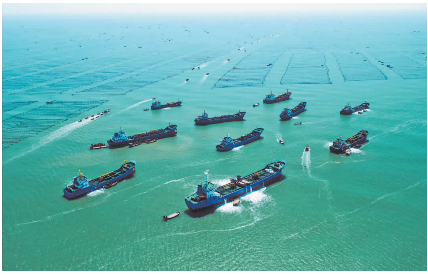
5月5日,山东省荣成市爱伦湾养殖区,多艘运输船正在运送鲍鱼养殖箱。随着气温回升,养殖工人将在福建海域“过冬”归来的鲍鱼卸到养殖船,再运往当地的养殖区继续养殖。目前,已有52万笼鲍鱼回到荣成“度夏”。