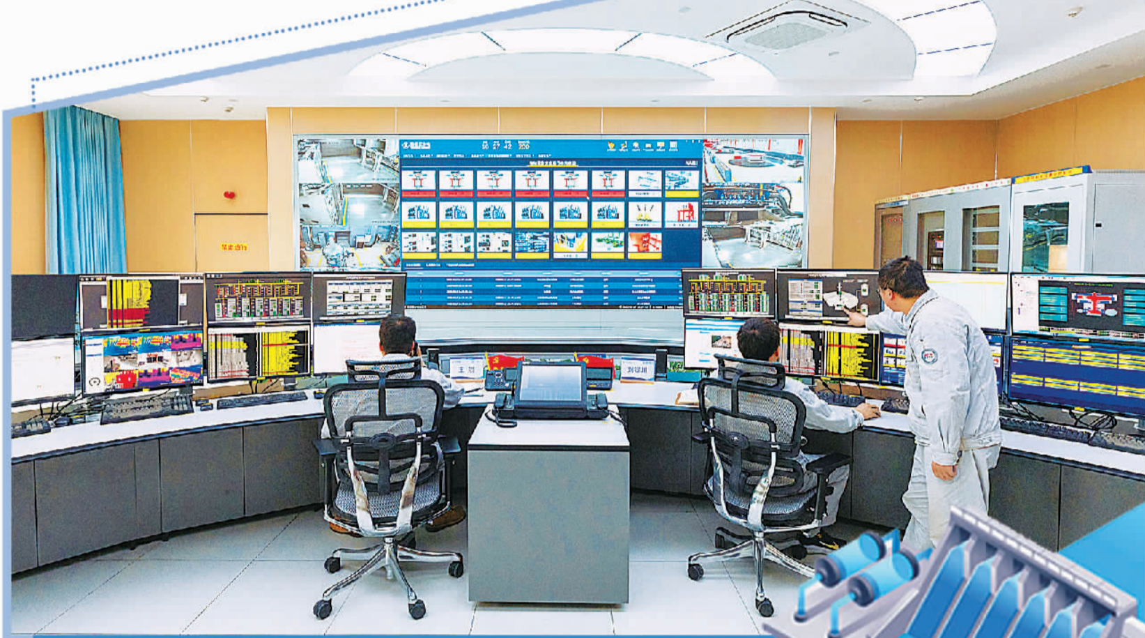
在雅砻江两河口水电站中控室,值班员利用智能监控系统监测水电运行情况。两河口水电站设计年发电量超过110亿千瓦时。

因此,适时推动组建全国电力交易中心,建立依法规范、权责分明的公司法人治理体系和运营机制,完善议事协调和监督机制,破