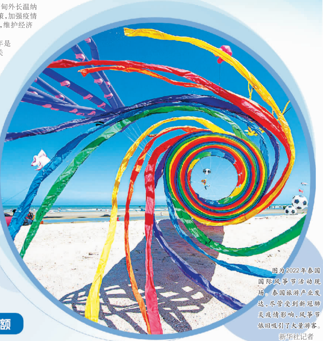
图为2022年泰国国际风筝节活动现场。泰国旅游产业发达,尽管受到新冠肺炎疫情疫情影响,风筝节依旧吸引了大量游客。