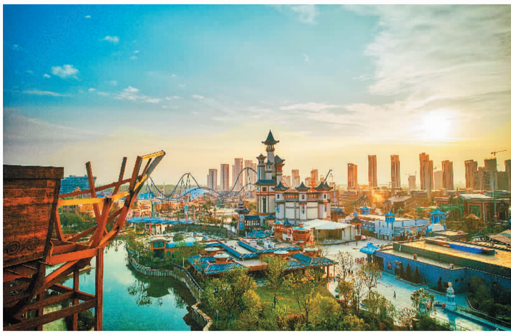
襄阳华侨城奇幻度假区的主题乐园奇幻谷

当前，亲子游已成为旅游市场的重要组成部分，奇幻谷规划初期充分考虑亲子游玩需求，超80%的项目适合亲子游玩，多样化的主题场馆和游乐设备既为年轻客群提供惊险刺激的娱乐体验，又能让亲子家庭融入其中尽情玩乐。当游客走进奇幻谷，可以沉浸在神秘的中国传统奇幻文化时空之中，与现代机械美学的巨型机械麒麟“金璃”近距离互动；也可以体验国内动物主题的“方舟大冒险”、穿越火山主题“秘境漂流”，探索平行宇宙的奥秘，回溯人类文明发展的密码故事；还可以与孩子们在“星球情报局”“虫巢突围”“非常任务”等