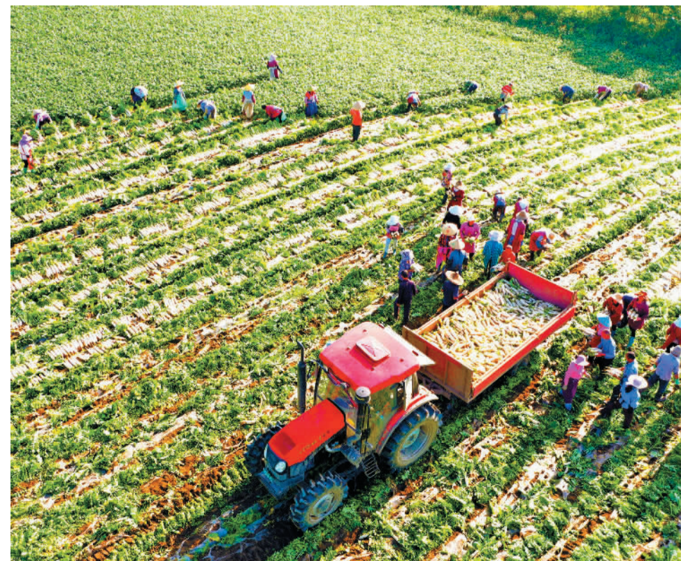
4月26日，在四川眉山市青神县青竹街道李时坝村，村民帮慈康家庭农场采收白萝卜。近日，青神县青竹街道通过家庭农场带动，利用河沙地成片种植的春季白萝卜喜获丰收，家庭农场抓紧组织采收销往省内外，以满足即将到来的“五一”假期市场需求。

“在积极鼓励App企业自我规制、良性合规的基础上，监管机构也应开展定期抽查、专项整治的系统性治理措施，适时创新技术治理方式，加强技管结合，比如工信部上线运行了全国App技术检测平台管理系统。”张欣建议，还应切实落实平台主体责任，建立科学有效的问责机制，从源头和关键环节实施精准治理。