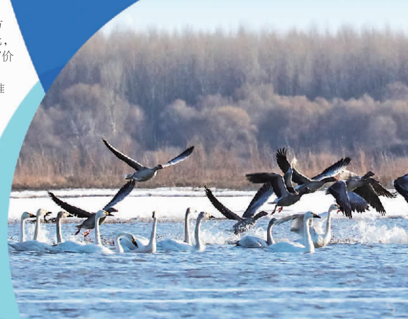
本版编辑 陈莹莹 徐晓燕 美编 倪梦婷