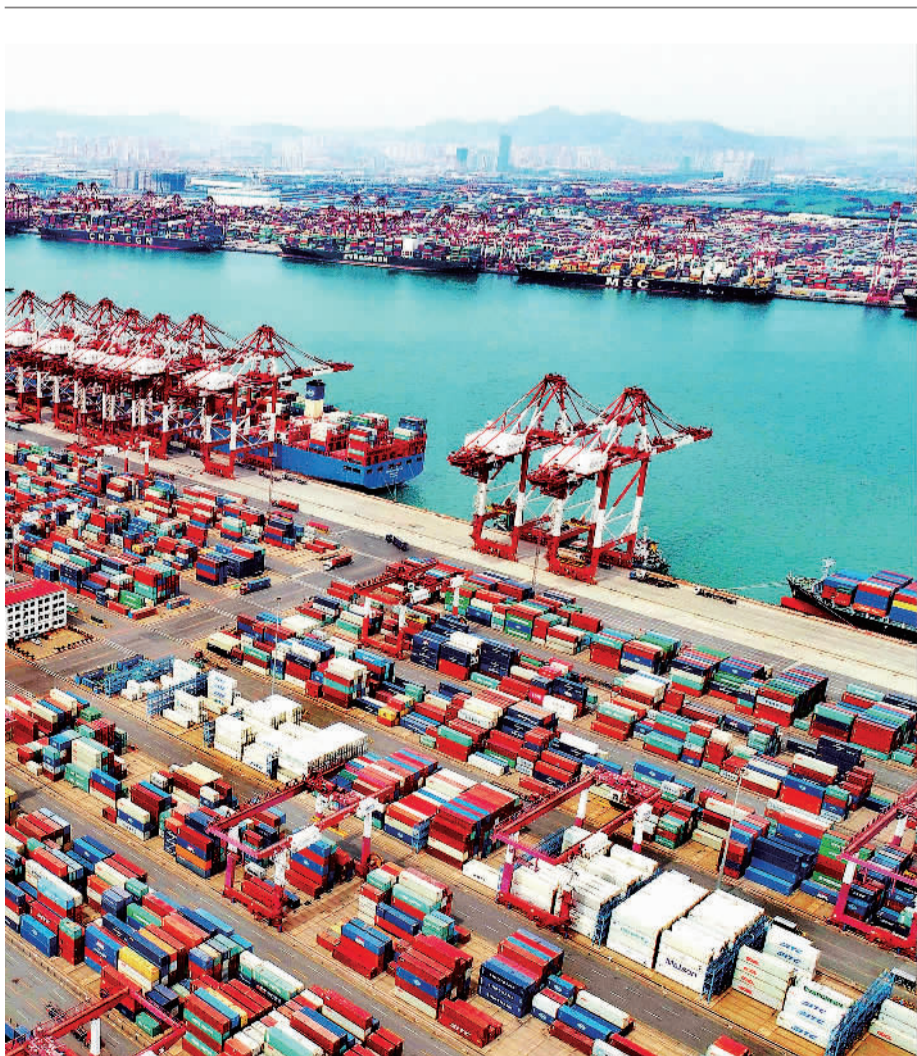
4月13日,在山东港口青岛港全自动化码头,高速轨道吊在集装箱堆场来回穿梭。今年第一季度,山东港口货物吞吐量同比增长6.3%,集装箱吞吐量同比增长7.6%,货物吞吐量和集装箱吞吐量实现双增长。

据了解,ETC发行服务机构与支付机构同属市场主体,可在平等自愿原则下依法开展合作,对于ETC储值卡用户使用何种支付方式进行充值,国家层面并没有统一要求。对此,交通运输部公路局表示,交通运输部将指导各地依法依规优化提升ETC发行和充值等相关工作,更好服务公众便捷高效出行。对已经办理ETC储值卡的用户,可继续使用ETC储值服务,继续采用“先储值、再通行”的方式通行收费公路,不会受到任何影响。