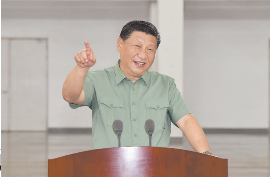
4月12日下午,中共中央总书记、国家主席、中央军委主席习近平到文昌航天发射场视察,代表党中央和中央军委,向发射场全体同志致以诚挚问候。这是习近平发表重要讲话。