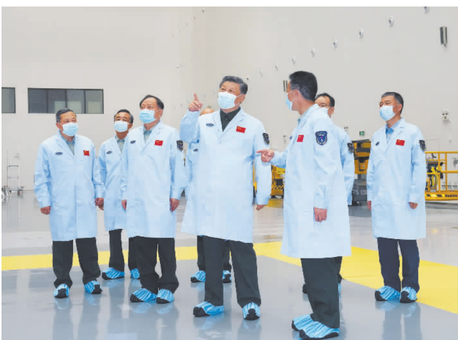
4月12日下午,中共中央总书记、国家主席、中央军委主席习近平到文昌航天发射场视察,代表党中央和中央军委,向发射场全体同志致以诚挚问候。这是习近平来到技术测试厂房,详细了解有关任务准备情况。