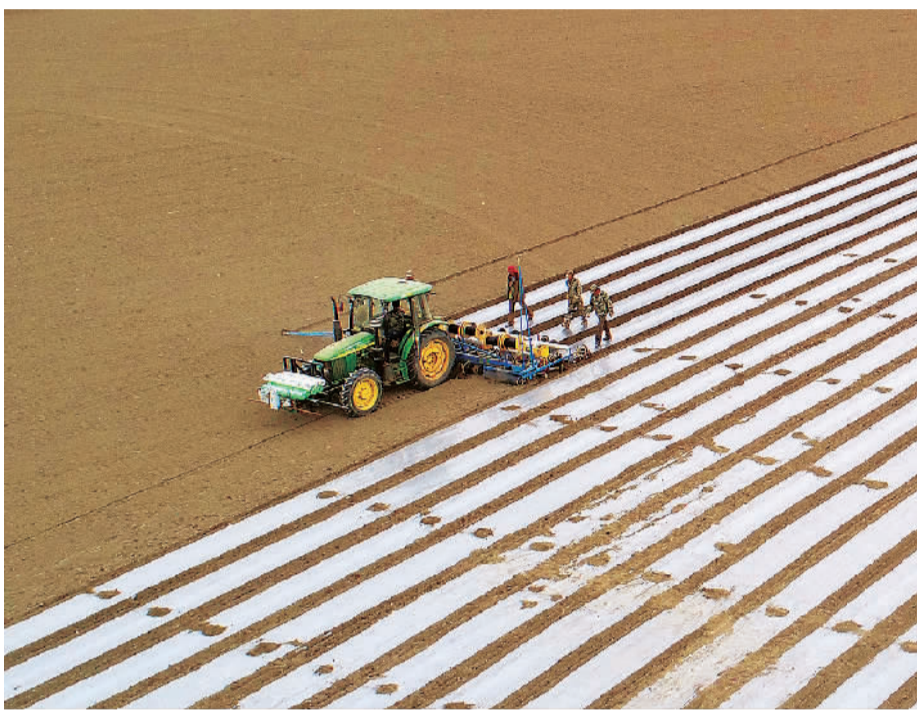
4月6日,新疆铁门关市二十九团,一台装有卫星定位导航系统的大型播种机开足马力播种棉花。今年,该市计划播种棉花70多万亩,将于4月上旬完成播种任务。

数据显示,四川已引进培育科技服务、生产经营、加工营销等龙头企业近2000家、农民合作社15732家、家庭农场约1.4万家。