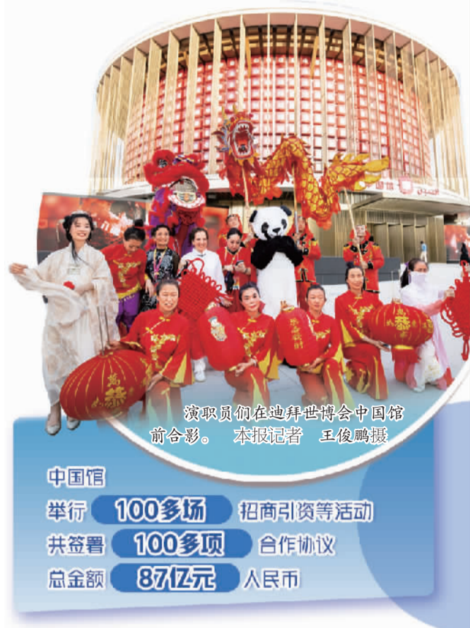
演员们在迪拜世博会中国馆前合影。

中国馆 举行 100多场 招商引资等活动 共签署 100多项 合作协议 总金额 87亿元 人民币