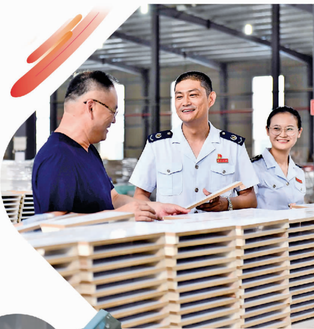
在菏泽金然木制品有限公司,山东省菏泽市曹县税务局的工作人员上门走访,介绍出口退税相关优惠政策。

征管改革有效降低征纳成本、提高征管效率,在让纳税人有更多获得感的同时,税收服务国家治理的效能也进一步提升。税收在国家治理中的基础性、支柱性、保障性作用进一步发挥,为国家经济社会发展提供强大财力保障。