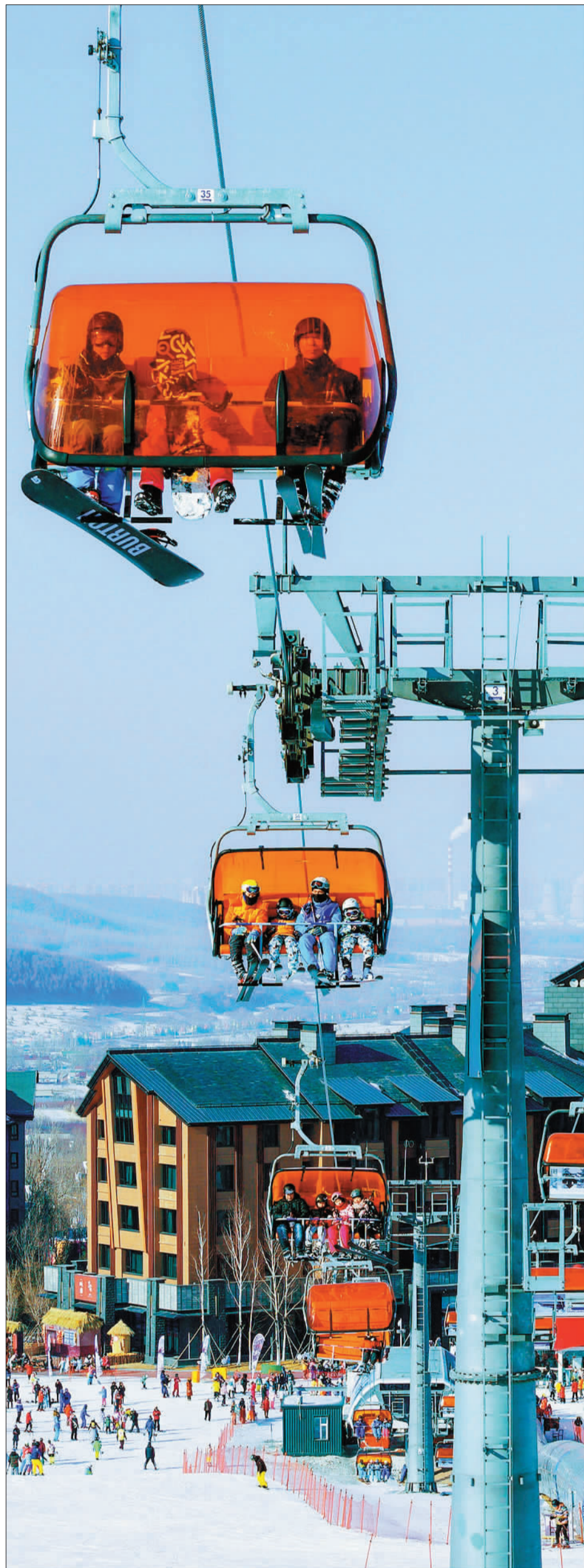
►滑雪爱好者在吉林市万科松花湖滑雪场乘坐缆车。如今，越来越多的人将滑雪作为冬季旅游或周末度假的体验项目。