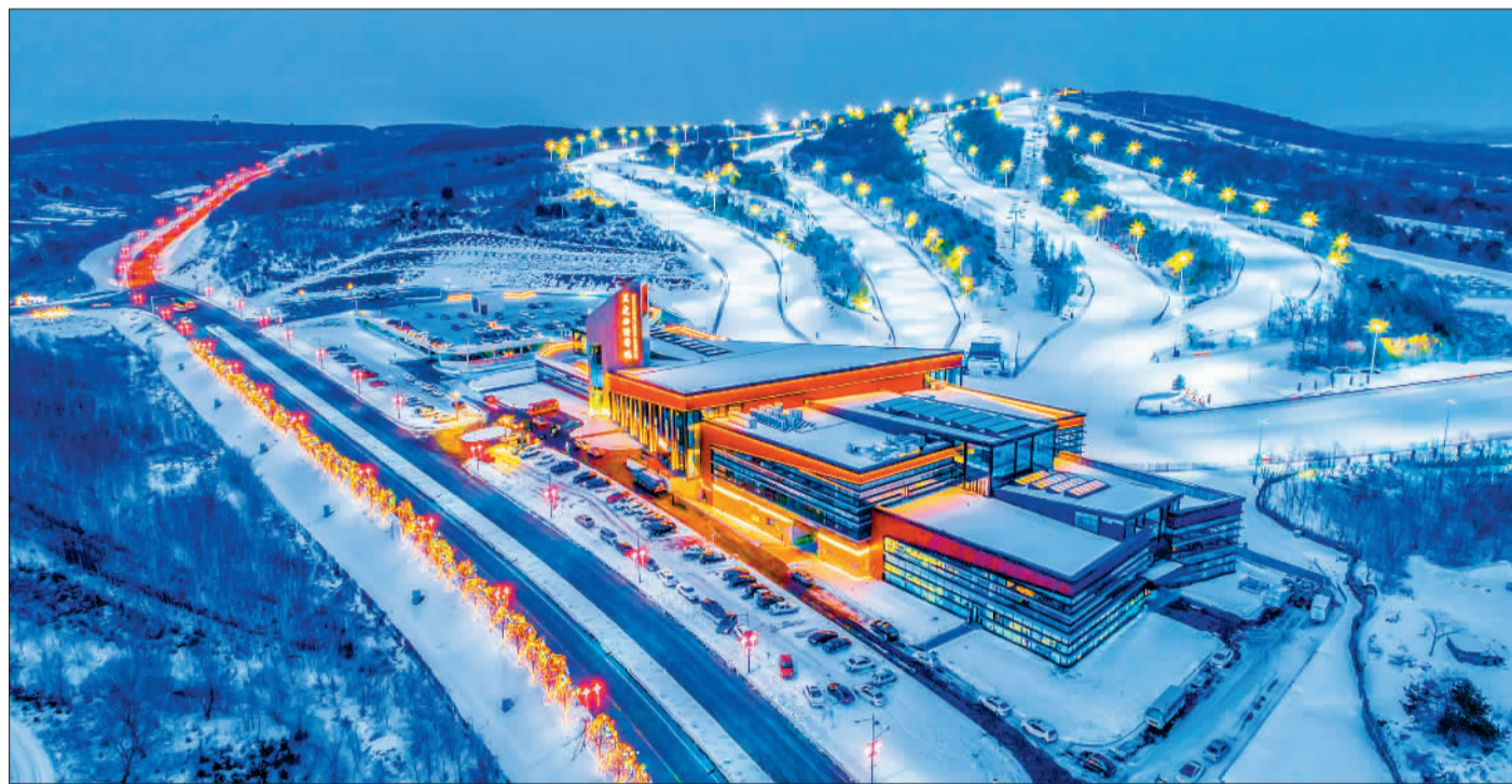
▲位于吉林省长春市莲花山景区的天定山滑雪场配套设施齐全，可全方位满足滑雪爱好者的不同需求。