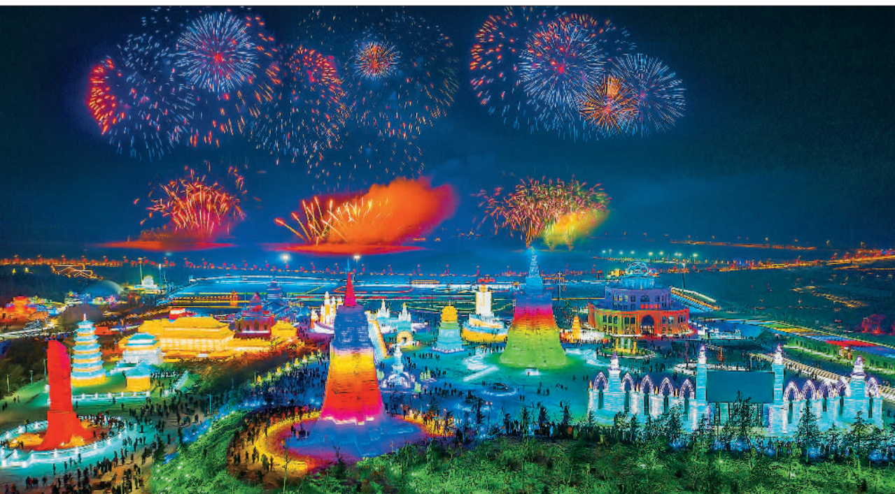
▼长春冰雪新天地是集冰雪观光、冰雪游乐、冰雪研学、冰雪科技为一体的“冰雪+”深度游主题乐园，园内众多冰雪娱乐项目，可以让游客近距离感受冰雪的无限魅力。