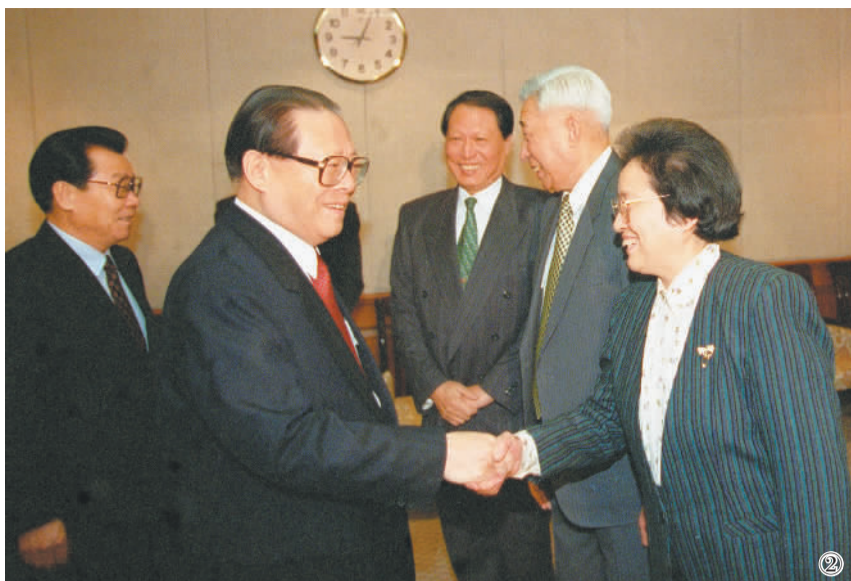
图② 1997年1月1日，江泽民同志在北京会见民革中央新任主席何鲁丽同志。