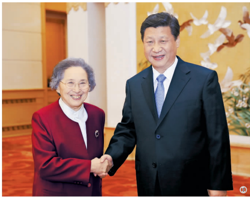
图① 2014年1月22日，中共中央举行党外人士迎春座谈会。这是习近平同志与何鲁丽同志在一起。