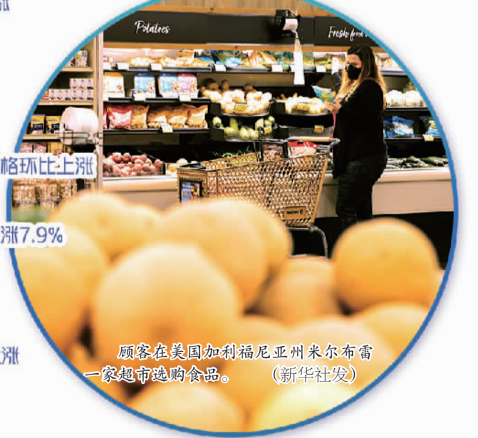
顾客在美国加利福尼亚州米尔布雷一家超市选购食品。

到每桶150美元，全球经济将停止增长，通胀率将冲高到7%以上。 再次，全球劳动力短缺问题尚未显著改善，生产原料、运输和储存成本继续走高，供应链不畅，多国通胀率不同程度地继续上升。在全球经济高度关联的当下，美国经济难以独善其身，不可能不受牵连。 美国及全球经济同时面临增长放缓和通胀上扬的难题，考验美联储和各国央行。高企的通胀率为美联储3月份开始加息铺平了道路。但随着市场开始担心通胀将继续加剧，削弱经济增长，带来滞胀风险，美联储在未来货币政策的选择上将更加困难。