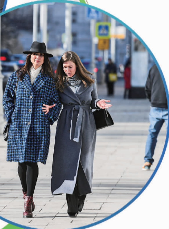
3月15日，行人走在俄罗斯首都莫斯科街头。