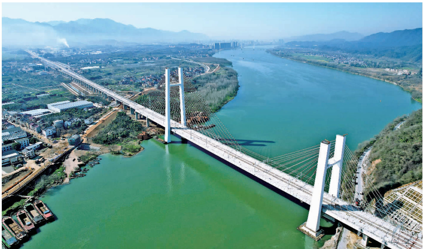
3月14日,正在进行轨道精调及电气化施工作业的湖杭铁路(合杭高铁湖杭段)浙江杭州富春江特大桥。 湖杭铁路是国家高速铁路网主骨架合杭、宁杭铁路的南延通道,计划今年4月份开始联调联试,8月底前具备通车条件,并确保在杭州亚运会前实现全线通车。