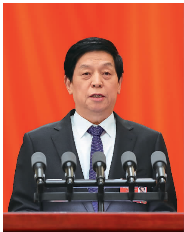
3月8日,十三届全国人大五次会议在北京人民大会堂举行第二次全体会议。受全国人大常委会委托,栗战书委员长向大会报告全国人大常委会工作。