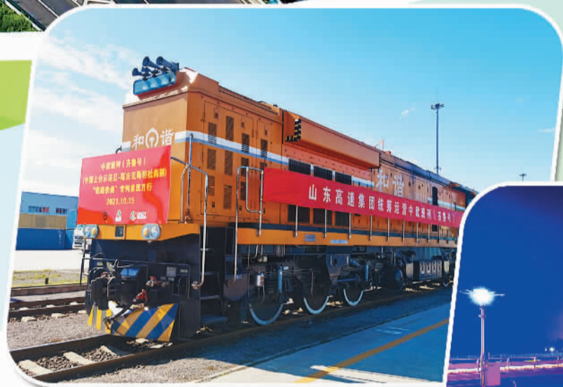
山东高速集团 统筹运营中欧班列 (齐鲁号)