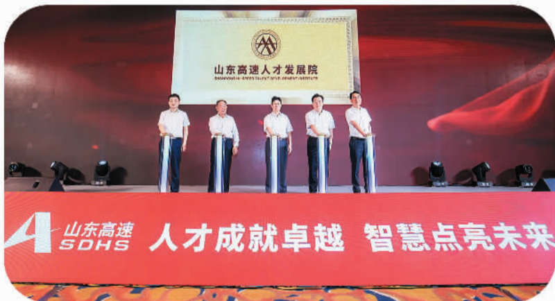
2021年6月29日,山东高速人才发展院揭牌成立