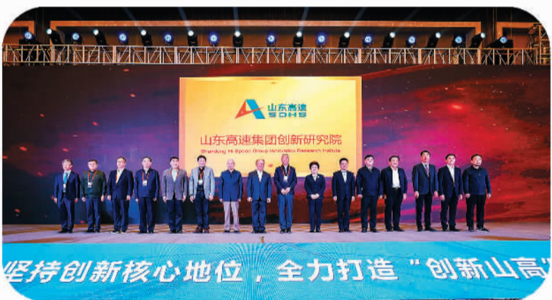
2021年4月20日,山东高速集团创新研究院揭牌成立