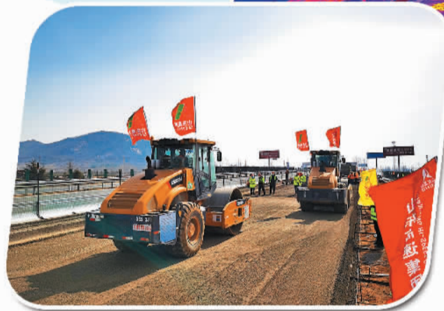
山东高速集团 重点项目建设现场

营业收入首次突破2000亿元大关,利润总额、净利润均创集团历史新高,迈向世界500强的进程蹄疾步稳,这是山东高速集团2021年交出的经营“成绩单”。