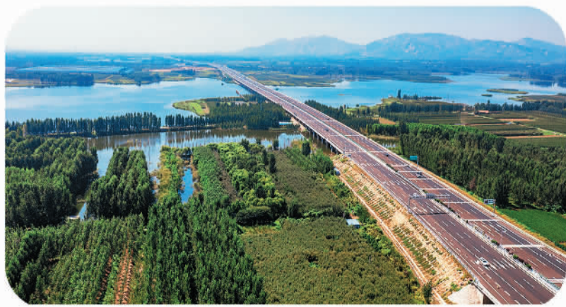
2021年9月29日,山东高速集团投资建设的“改扩建+智慧高速”交通强国试点项目建成通车