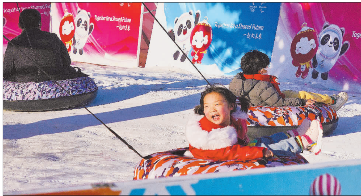
▲2月5日，小朋友在北京陶然亭公园享受冰雪运动带来的快乐。今冬北京市属公园共计开放11处冰雪嬉戏体验场地，提供40余种冰雪活动，方便市民和游客“逛公园、上冰雪、迎冬奥”。

活动了筋骨，也涵养了精神。新年伊始，给自己立个健身小目标，给生活增加一份期待。看看大好河山的美景，感受春回大地的生机，想想新一年的打算，元气满满回归岗位，再启新程。