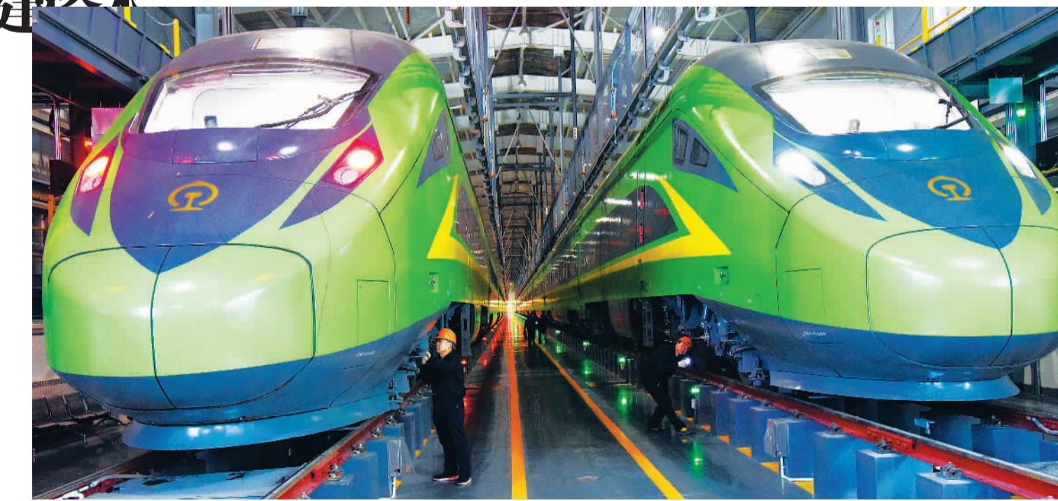
1月10日,内蒙古呼和浩特,铁路职工正在检修“绿巨人”动车组。时速160公里的CR200J型复兴号动车组被称为“绿巨人”。为备战春运,铁路职工挑灯夜战,通力合作,对“绿巨人”全面体检,确保旅客出行安全。

数据表明,从2019年3月注册制改革以来,我国证券公司服务超330家“硬科技”企业登陆科创板,实现IPO融资超4000亿元;服务超226家成长型创新创业企业登陆创业板,实现IPO融资超1748亿元,培育了一批拥有核心技术创新能力的优质企业。同时,证券公司承销发行创新创业