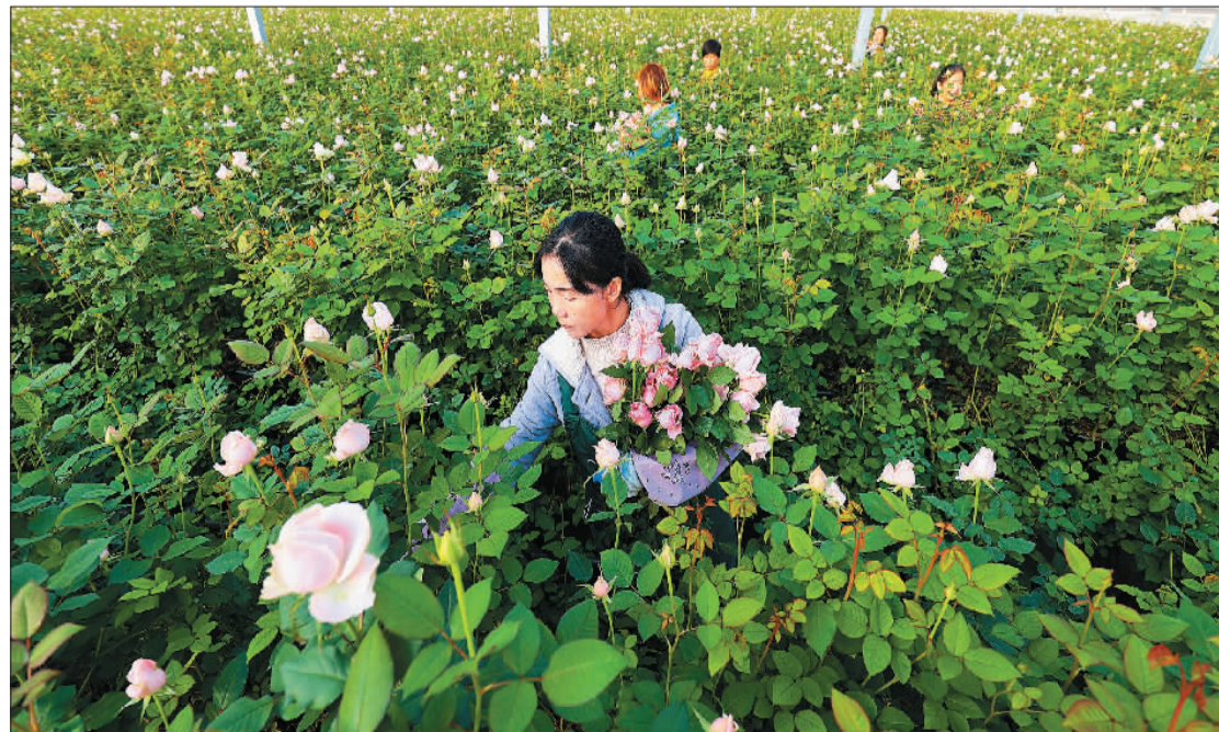
▼邯郸市邱县盛水湾玫瑰产业园，花农在采摘玫瑰花。该园区主要面向京津冀和长三角市场，全年可产鲜切花1500万枝，产值达3000万元。