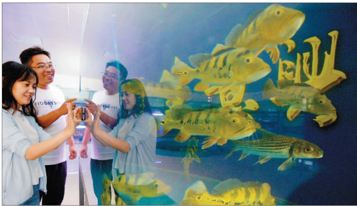
►邯郸市肥乡区旧店乡东辛寨村观赏鱼展厅，游客在参观游览。肥乡区依托传统养殖优势，大力发展观赏鱼经济，拓展农民增收渠道。目前，邯郸市正集中力量打造提升全市77个市级以上现代农业园区和23个现代农业精品园区，同时推进县级农业园区提档升级。