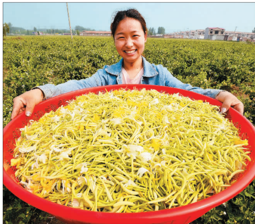
►邯郸市磁县磁州镇东侯召村村民展示刚采收的金银花。该县大力发展金银花等中药材种植业，带动农民增收。