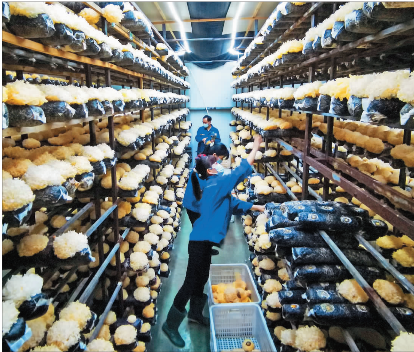
▲位于邯郸市魏县的河北绿珍食用菌有限公司，工人在采摘银耳。该企业通过“企业+基地+村集体+农户”模式，发展特色种植产业，日产银耳3万多棒，年产值突破1亿元。

乡村产业“接二连三”，让邯郸农民与产业联结更紧密。通过探索联农带农机制，邯郸市构建合作制、股份制、订单农业以及财政资金折股量化等多种利益联结机制，帮助农民增收节支、分享园区增值收益。据统计，全市园区经营主体直接吸纳农民就业人数19.8万人，辐射带动园区外农民120.9万人。