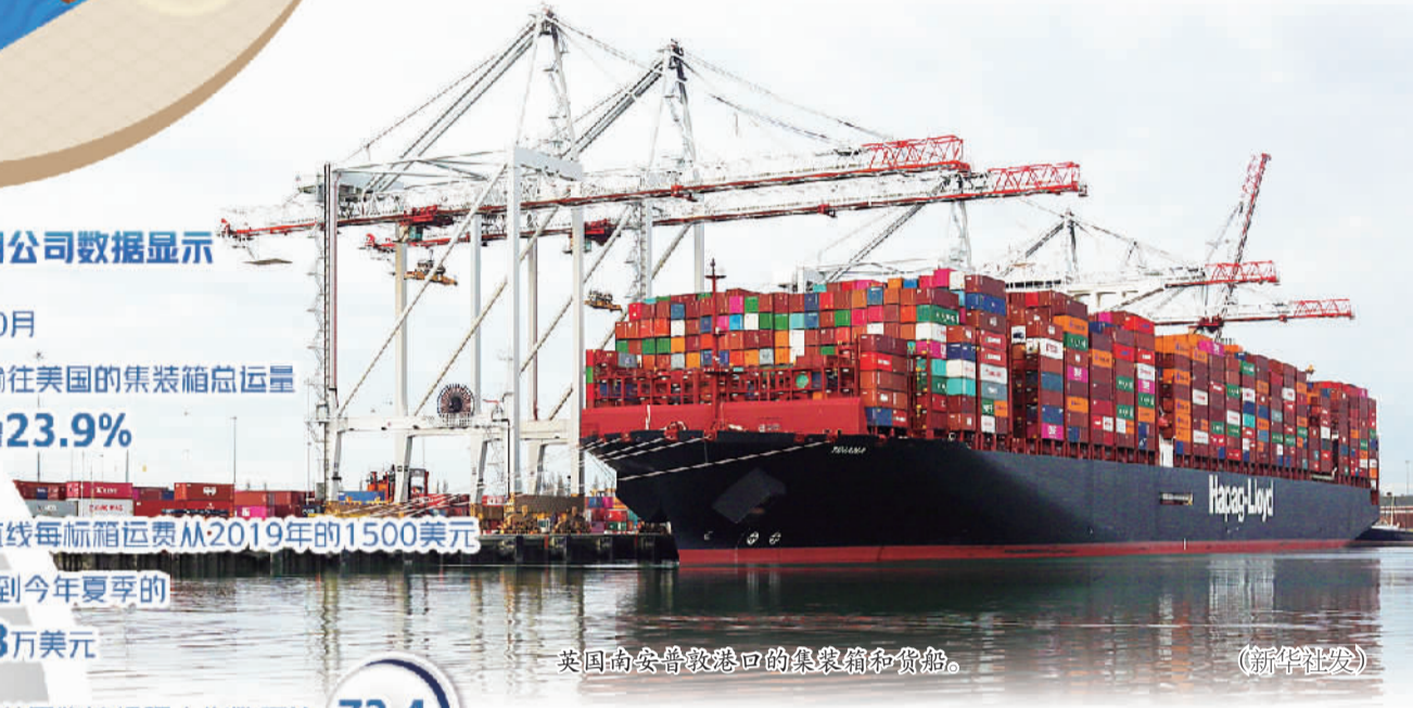
英国南安普敦港口的集装箱和货船。