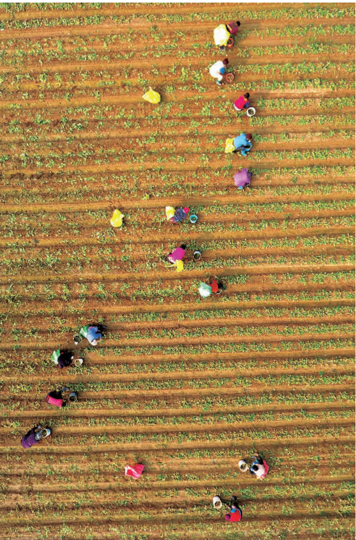
11月19日,在山东省聊城市茌平区贾寨镇贾寨后村,村民在田间收获水果萝卜。初冬时节,当地农民抢抓农时,开展田间农作物的采收、管理、越冬保温等工作,田间地头一派忙碌景象。

最近,一则南京老旧楼宇通过改造实现蝶变的新闻引起关注:建于1996年的南京秦淮区九广大厦过去一直依靠传统商业,效益不高。2016年,经过一番软硬件改造升级,引进总部经济和行业龙头企业入驻,实现转型。2020年,这幢大楼的税收突破2亿元。 其实,不少大中城市的城区楼宇都曾面临这样的情况:空间布局起步早,但基础设施老化、软件服务跟不上;发展模式上主要以线下商业消费等传统模式为主,但业态同构性、水平低度化情况严重。随着互联网经济快速发展,发展短板逐步凸显。特别是新冠肺炎疫情影响下,线下业务减少,部分楼宇空置率有所上升。因此,提升楼宇服务能级,推动转型升级迫在眉睫。 老旧楼宇“活化”、发展楼宇经济要更加看重运营服务的附加值,紧盯城市产业结构向服务型经济转变的大势,把握楼宇经济转型升级机遇,实施精准培育、分类对待。 在提升楼宇服务能级时,既要注重硬件设施更新,又要注重科技化、智能化的塑造,提高楼宇智能化、信息化管理水平,创造安全、绿色、智能、健康、舒适的运营空间,以适应新经济的发展需求。 营商环境建设对于吸引企业入驻同样重要。深化“放管服”改革,制定鼓励和支持楼宇经济发展的具体政策,构建灵活高效的楼宇招商及管理服务机制,营造亲商、安商、便商的制度环境,实现服务上楼、政策进楼,让企业满楼。 改造更新后的楼宇载体,更需在产业上“精挑细选”。结合本地自然条件、文化资源、产业特色、发展战略等,走错位发展、差异化发展、特色发展之路,“一楼一策”、“一企一策”地鼓励创建特色产业楼宇。在运行上,引入项目准入评审机制,对社会化载体明确主导产业方向,培育一批金融楼、外贸楼、商务楼、科研楼、中介服务楼、现代物流楼等,打造核心竞争优势,避免同质化竞争。