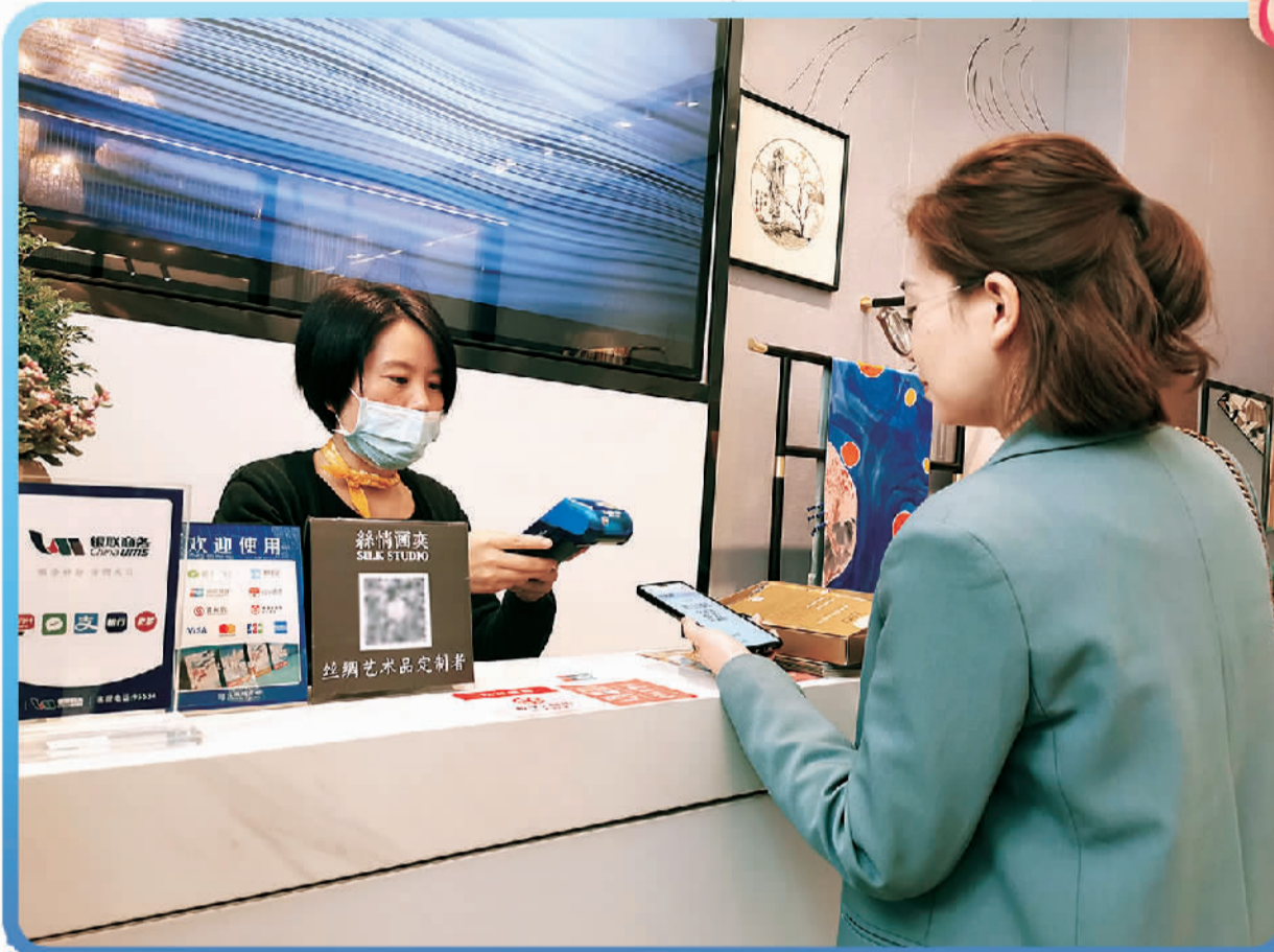
近日，在比斯特苏州购物村，消费者正在使用数字人民币购物。

放大。截至6月30日，对公钱包为351万余个；而到了10月22日，对公钱包达1000万个。数字人民币累计交易从6月30日的7075万余笔、345亿元到10月22日的1.5亿笔、620亿元，增长迅猛。由此可见，随着数字人民币场景的不断丰富，交易规模正在迅速扩大。