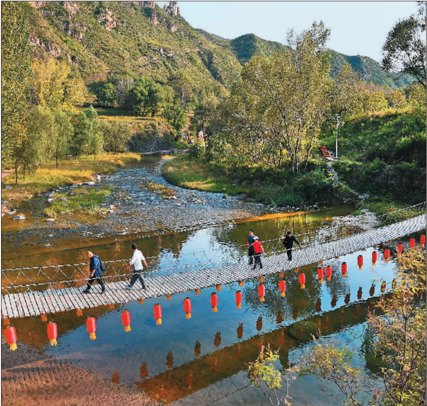
▼游客在灵丘县独峪乡花塔村游玩。该县充分发挥生态资源优势,做优生态旅游,将美景变成百姓生活的好光景。