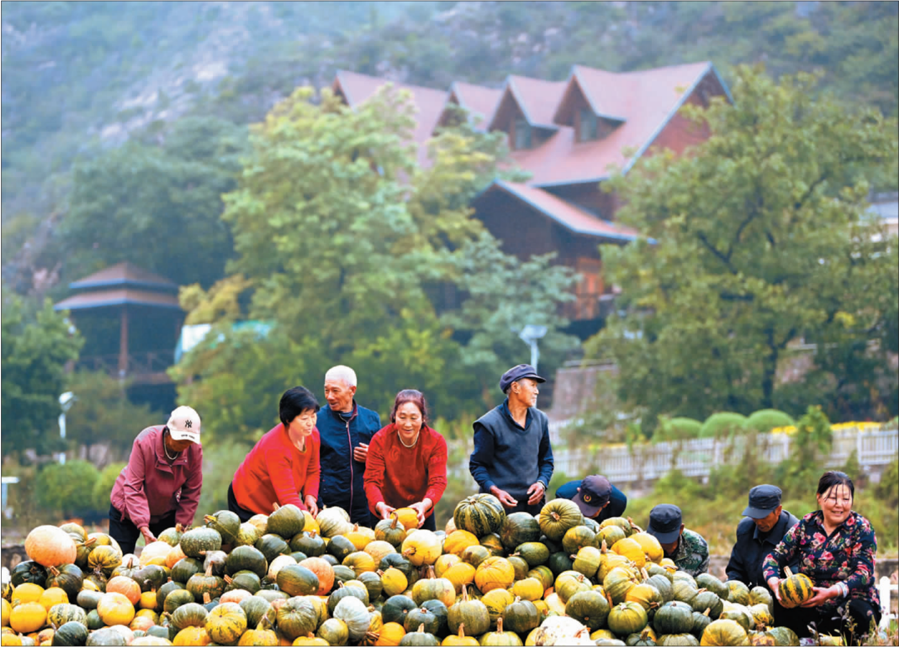
◀山西灵丘县车河有机社区,村民在展示收获的南瓜。该社区是灵丘县平型关国家有机农业公园打造的首个试点,实现了农村景区化、农业产业化,使曾经荒僻的山沟呈现出勃勃生机。