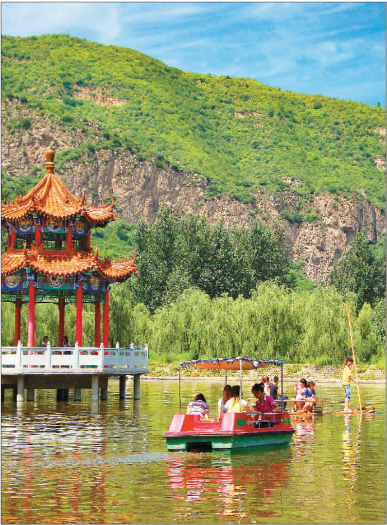
▼游客在灵丘县北泉村水上公园划船游玩,尽享乡村美景。