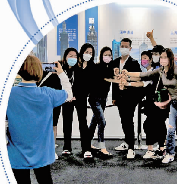
香港市民在大国建造主题展上合影留念。