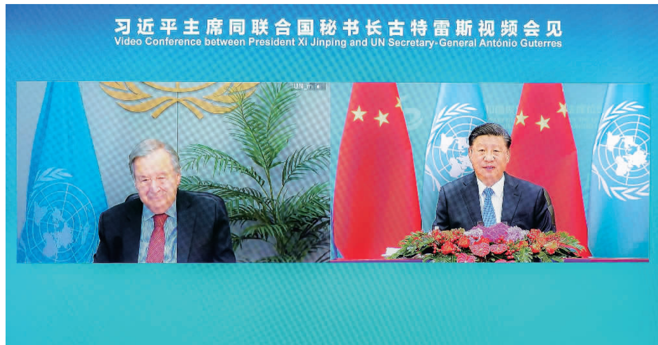
10月25日上午,国家主席习近平在北京人民大会堂以视频方式会见联合国秘书长古特雷斯。

新华社北京10月25日电 国家主席习近平25日上午在北京人民大会堂以视频方式会见联合国秘书长古特雷斯。中共中央政治局常委、中央书记处书记王沪宁参加会见。习近平指出,今天是新中国恢复在联合国合法席位50周年。中国举办纪念