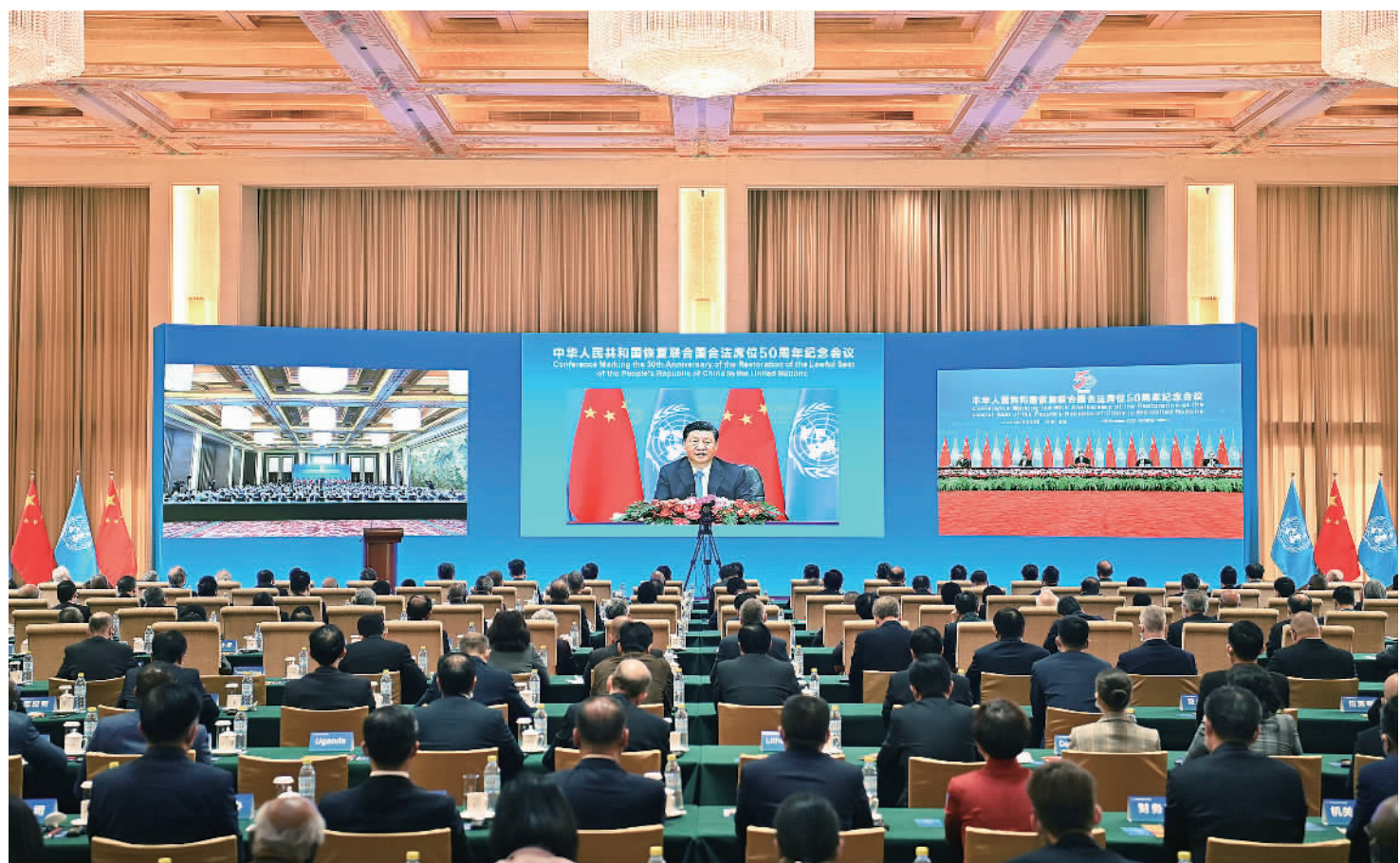
10月25日,国家主席习近平在北京出席中华人民共和国恢复联合国合法席位50周年纪念会议并发表重要讲话。

新华社北京10月25日电 国家主席习近平25日在北京出席中华人民共和国恢复联合国合法席位50周年纪念会议并发表重要讲话。习近平强调,新中国恢复在联合国合法席位以来的50年,是中国和平发展、造福人类的50年。中国将坚持走和平发展之路,始终做世界和平的建设者;坚持走改革开放之路,始终做全球发展的贡献者;坚持走多边主义之路,始终做国际秩序的维护者。中国愿同各国秉持共商共建共享理念,弘扬全人类共同价值,践行真正的多边主义,站在历史正