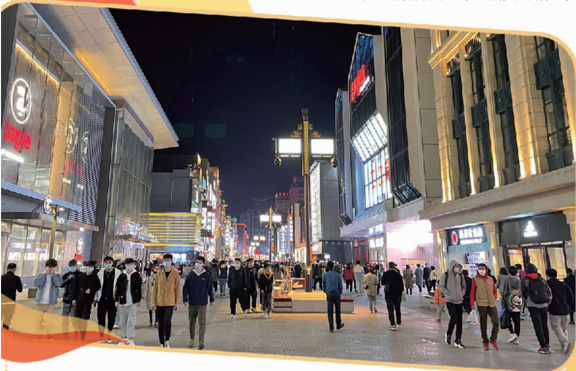
位于沈阳市沈河区的中街步行街，夜景璀璨。

良好生态环境是东北地区经济社会发展的宝贵资源，也是振兴东北的一个优势。东北生态资源禀赋突出，绿水青山就是金山银山，冰天雪地也是金山银山。更好支持生态建设，不断巩固提升绿色发展优势。东北全面振兴，必将浴火重生再出发。