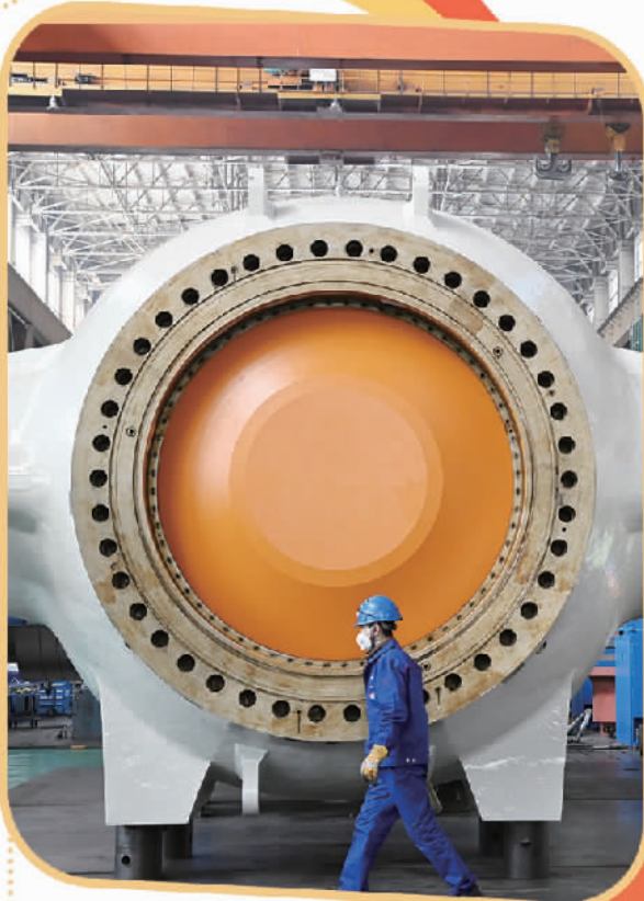
图为哈电集团哈尔滨电机厂有限责任公司生产车间。

在“百大项目”建设拉动下，黑龙江省经济正呈现加速回升态势，经济增长“稳定器”作用明显。2020年，“百大项目”拉动黑龙江省全年固定资产投资同比增长3.6%，高于全国0.7个百分点。截至今年10月1日，“百大项目”今年已开工228个，开工率99.1%，完成投资1603.5亿元，投资完成率88.6%，高于去年同期25.1个百分点。拉动上半年全省固定资产投资同比增长15.2%，高于全国2.6个百分点。带动全省固定资产投资项目开工3380个，施工数同比增长15.3%。