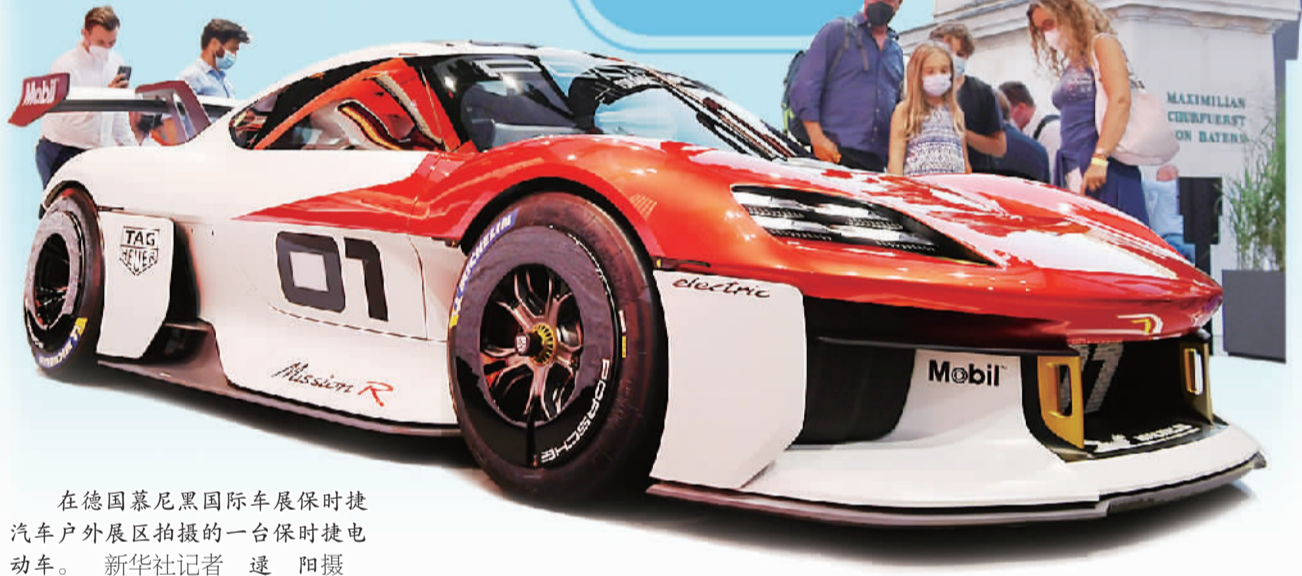
在德国慕尼黑国际车展保时捷汽车户外展区拍摄的一台保时捷电动车。

去年年底 欧盟19国签署协议 实施“欧洲电子芯片和 半导体产业联盟计划” 加大对该行业 全产业链投资