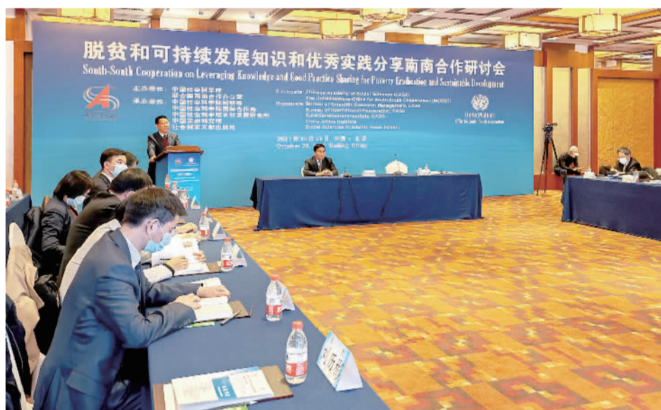
10月21日,“脱贫和可持续发展知识和优秀实践分享南南合作研讨会”在北京举行,图为论坛现场。

当前,新冠肺炎疫情反复,世界经济复苏仍具有脆弱性和不确定性,2030年可持续发展议程落实面临严峻挑战。在此背景下,广大发展中国家共话减贫大计,共