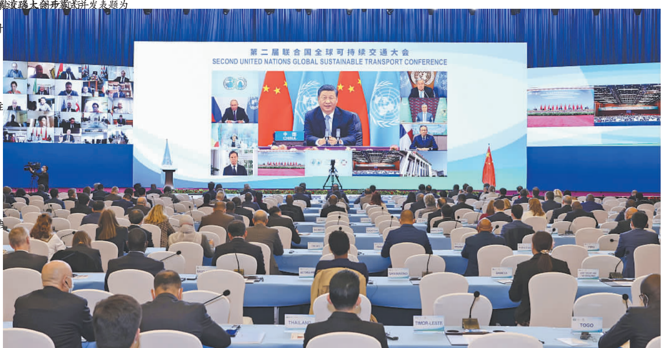
第二届联合国全球可持续交通大会开幕式现场