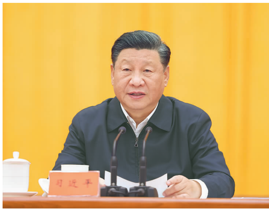
10月13日至14日,中央人大工作会议在北京召开。中共中央总书记、国家主席、中央军委主席习近平出席会议并发表重要讲话。

习近平强调,要用好宪法赋予人大的监督权,实行正确监督、有效监督、依法监督。各级人大及其常委会要聚焦党中央重大决策部署,聚焦人民群众所思所