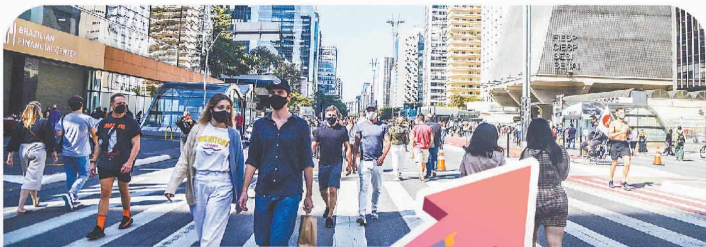
7月18日,市民走在巴西圣保罗市的保利斯塔大街上。

拉共体成立以来,大大推动了本地区经济的可持续发展,为各国创造出新的发展机遇。拉共体人均GDP居发展中国家前列,市场消费需求潜力大;全球经济影响力不断扩大,经济结构脆弱性有所改观;贫富差距扩大在较大程度上得到遏制,社会稳定性有所提高;努力推进科技创新,抢占产业发展制高点。但想让拉美“山鹰”振翅高飞,跨越中等收入陷阱,还需切实将潜力转变为高质量发展的动力。