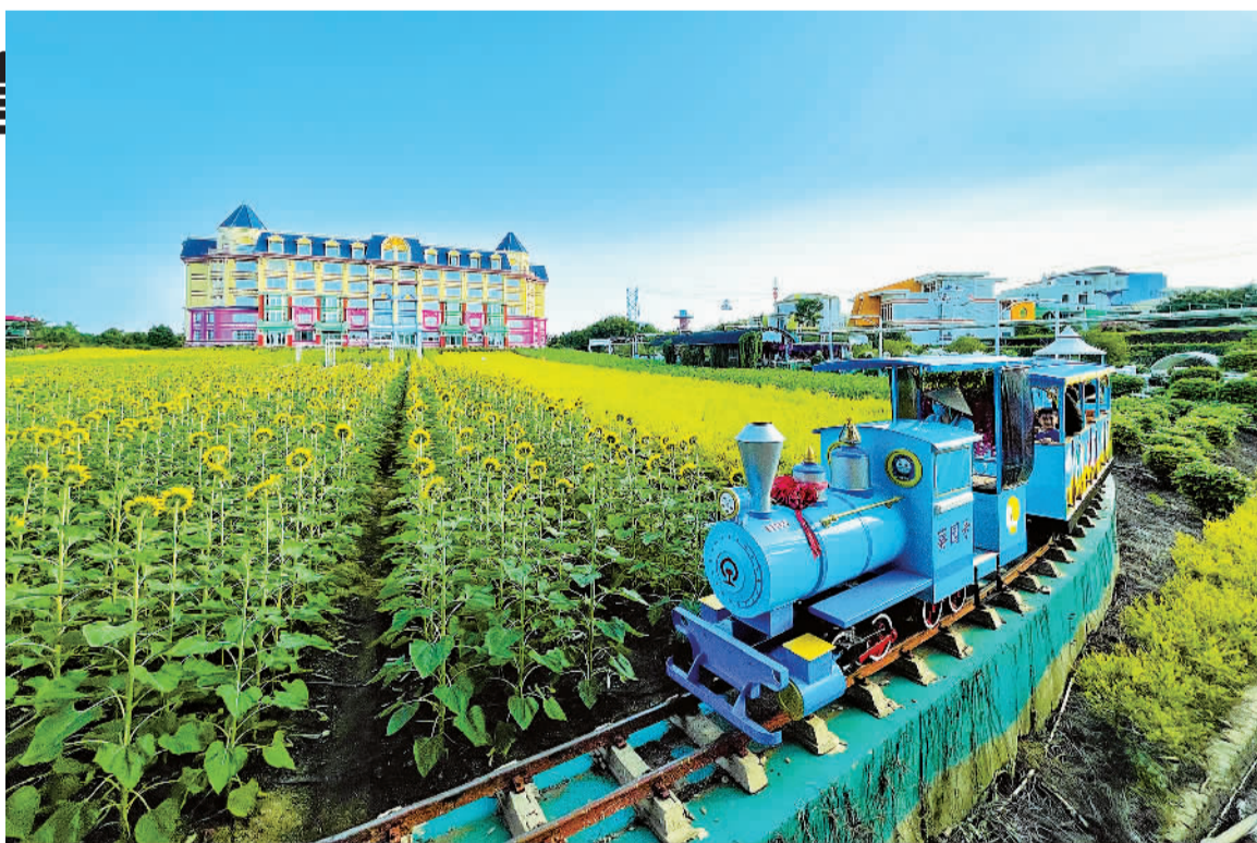
10月2日,广东广州市南沙区百万葵园风景区向日葵盛开,吸引了众多游客观光“打卡”。

国家发展靠人才,民族振兴靠人才。近年来,我国教育部门坚持为党育人、为国育才,聚焦关键环节,创新人才培养机制,打造人才培养新格局。