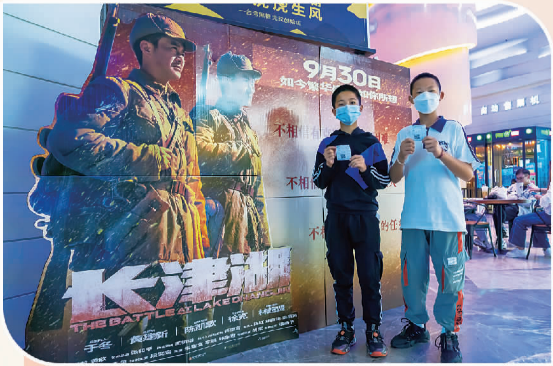
10月1日,在昆明一家电影院,观众在电影《长津湖》展板前合影。