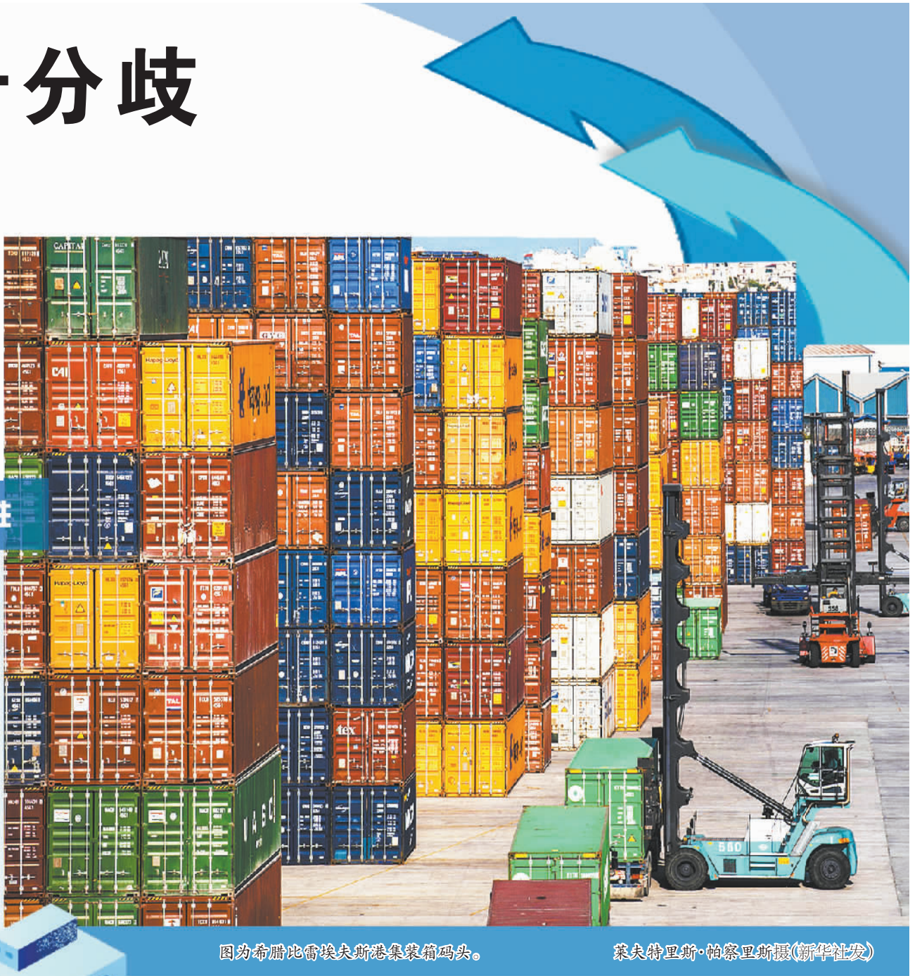
图为希腊比雷埃夫斯港集装箱码头。