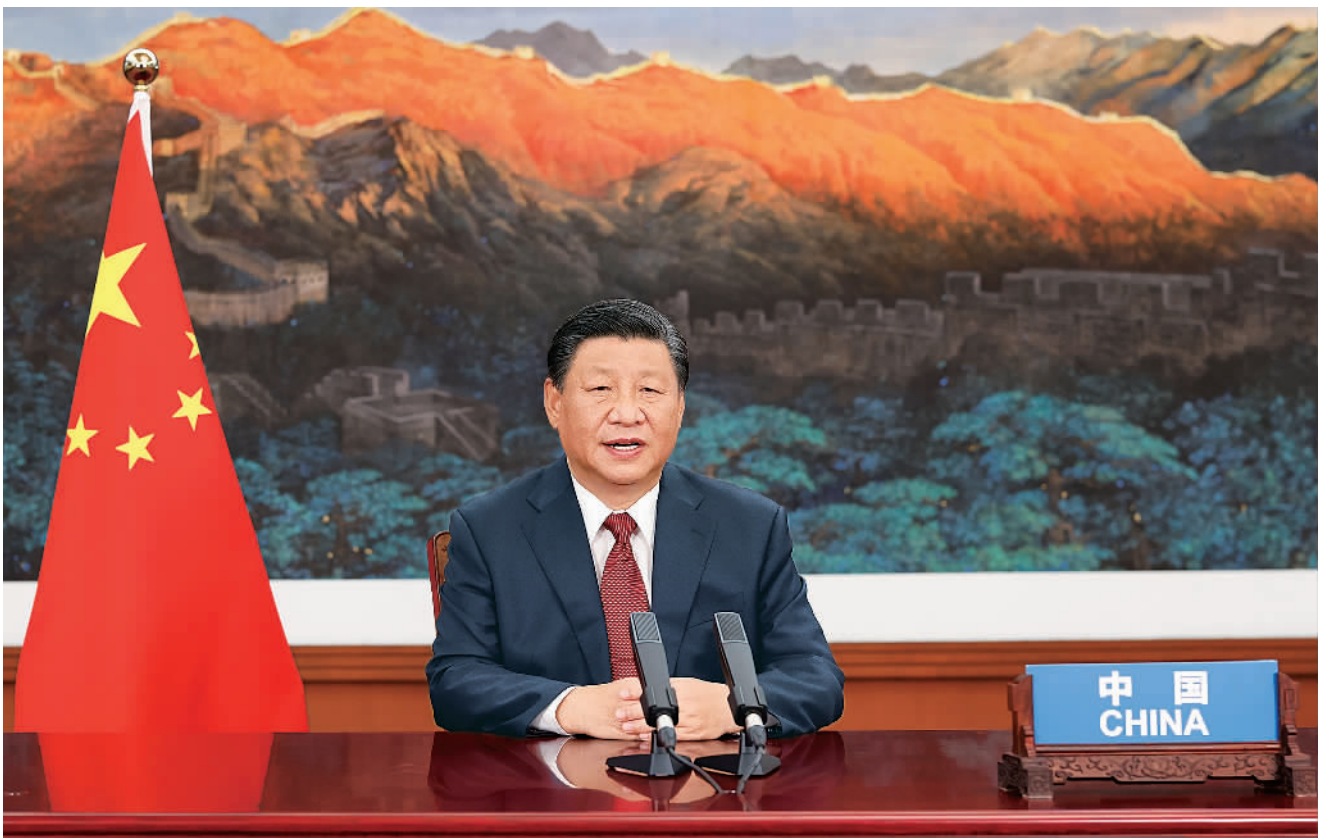
9月21日, 国家主席习近平在北京以视频方式出席第七十六届联合国大会一般性辩论并发表题为《坚定信心 共克时艰 共建更加美好的世界》的重要讲话。

新华社北京9月21日电 国家主席习近平21日在北京以视频方式出席第七十六届联合国大会一般性辩论并发表题为《坚定信心 共克时艰 共建更加美好的世界》的重要讲话。(讲话全文见二版) 习近平指出, 今年是中国共产党成立100周年, 也是中华人民共和国恢复在联合国合法席位50周年, 中国将隆重纪念这一历史性事件。我们将继续积极推动中国同联合国合作迈向新台阶, 为联合国崇高事业不断作出新的更大贡献。 习近平强调, 一年前, 各国领导人共同出席了联合国成立75周年系列峰会, 承诺合作抗击疫情, 携手应对挑战, 坚持多边主义, 加强联合国作用, 构建今世后代的共同未来。一年来, 世界百年未有之大变局和新冠肺炎疫情全球大流行交织影响。各国人民对和平发展的期盼更加殷切, 对公平正义的呼声更加强烈, 对合作共赢的追求更加坚定。 习近平强调, 当前, 疫情仍在全球肆虐, 人类社会已被深刻改变。世界进入新的动荡变革期。每一个负责任的政治家都必须以信心、勇气、担当, 回答时代课题, 作出历史抉择。 第一, 我们必须战胜疫情, 赢得这场事关人类前途命运的重大斗争。人类总是在不断战胜挑战中实现更大发展和进步。我们要坚持人民至上、生命至上, 弘扬科学精神, 秉持科学态度、遵循科学规律, 统筹疫情防控和经济社会发展, 加强国际联防联控。要把疫苗作为全球公共产品, 确保发展中国家的可及性和可负担性, 当务之急是要在全球范围内公平合理分配疫苗。中国将努力全年对外提供20亿剂疫苗, 在向“新冠疫苗实施计划”捐赠1亿美元基础上, 年内再向发展中国家无偿捐赠1亿剂疫苗。中国将继续支持和参与全球科学溯源, 坚决反对任何形式的政治操演。 第二, 我们必须复苏经济, 推动实现更加强劲、绿色、健康的全球发展, 共同推动全球发展迈向平衡协调包容新阶段。 习近平提出全球发展倡议: 一是坚持发展优先。将发展置于全球宏观政策框架的突出位置, 加强主要经济体政策协调, 保持连续性、稳定性、可持续性, 构建更加平等均衡的全球发展伙伴关系, 推动多边发展合作进程协同增效, 加快落实联合国2030年可持续发展议程。 二是坚持以人民为中心。在发展中保障和改善民生, 保护和