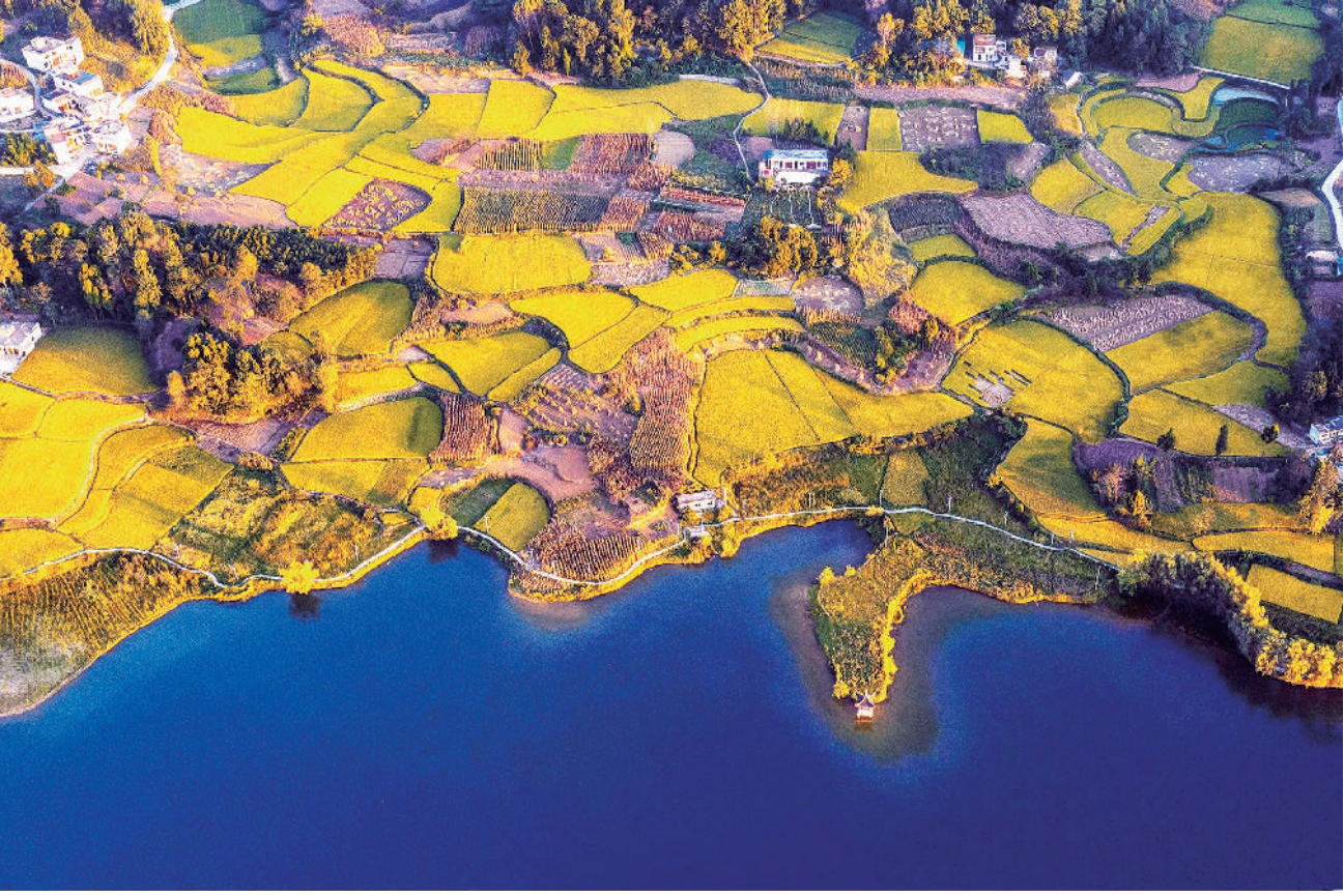
贵州省黔西市绿化乡大海子村稻田。时下,贵州省各地的水稻陆续成熟,田野山岗,一派丰收景象。

《意见》指出,要加强网络空间思想引领。坚持以习近平新时代中国特色社会主义思想统领互联网内容建设,推动党的创新理论走深走心走实。加强重点理论网站、公众账号、客户端建设,紧密结合中国特色社会主义伟大实践特别是新时代党和国家事业发展新变化新成就,有针对性地开展网上理论宣传活动。(下转第三版)