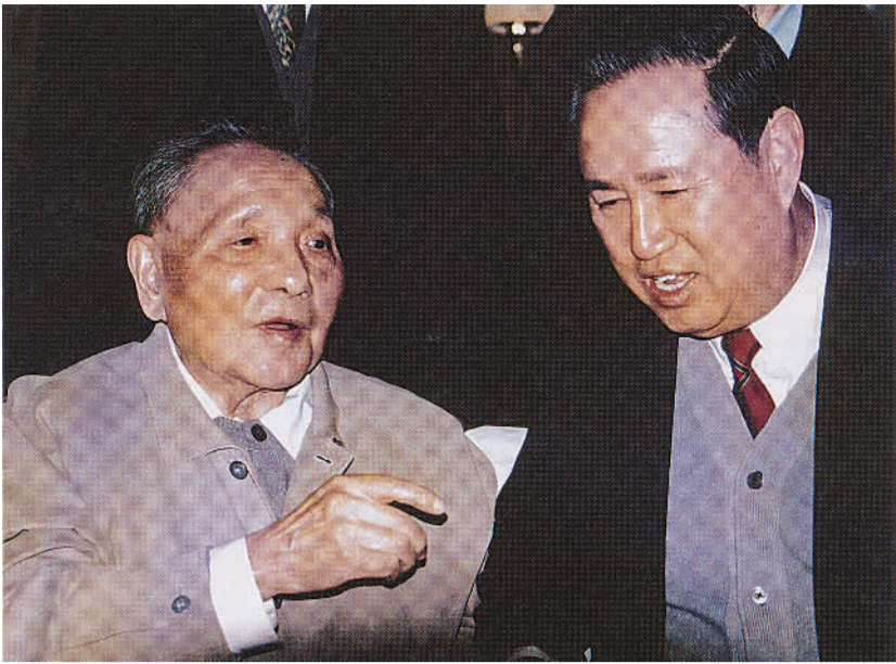
1993年12月9日，邓小平同志在济南听取姜春云同志汇报山东省经济社会发展情况。