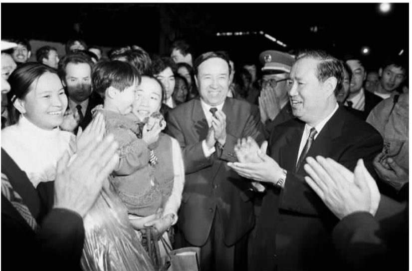
1995年10月2日，姜春云等同志同参加新疆维吾尔自治区成立40周年庆祝活动的乌鲁木齐市民亲切交谈。