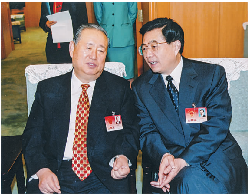
2002年3月，九届全国人大五次会议期间，胡锦涛同志与姜春云同志交谈。