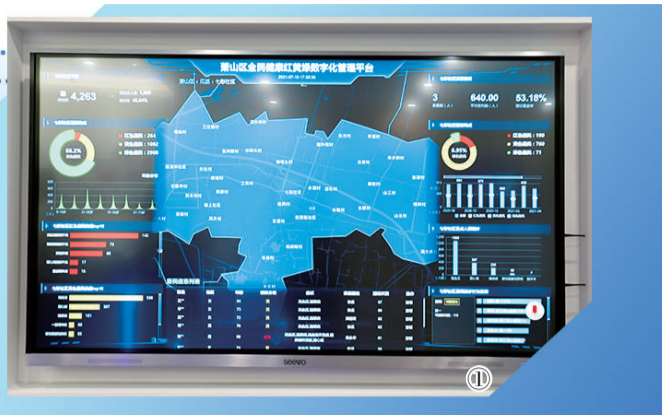
图① 杭州市萧山区瓜沥七彩未来社区的居民健康数字化管理平台。 图② 工作人员在杭州市萧山智慧城市指挥中心进行动态监测。