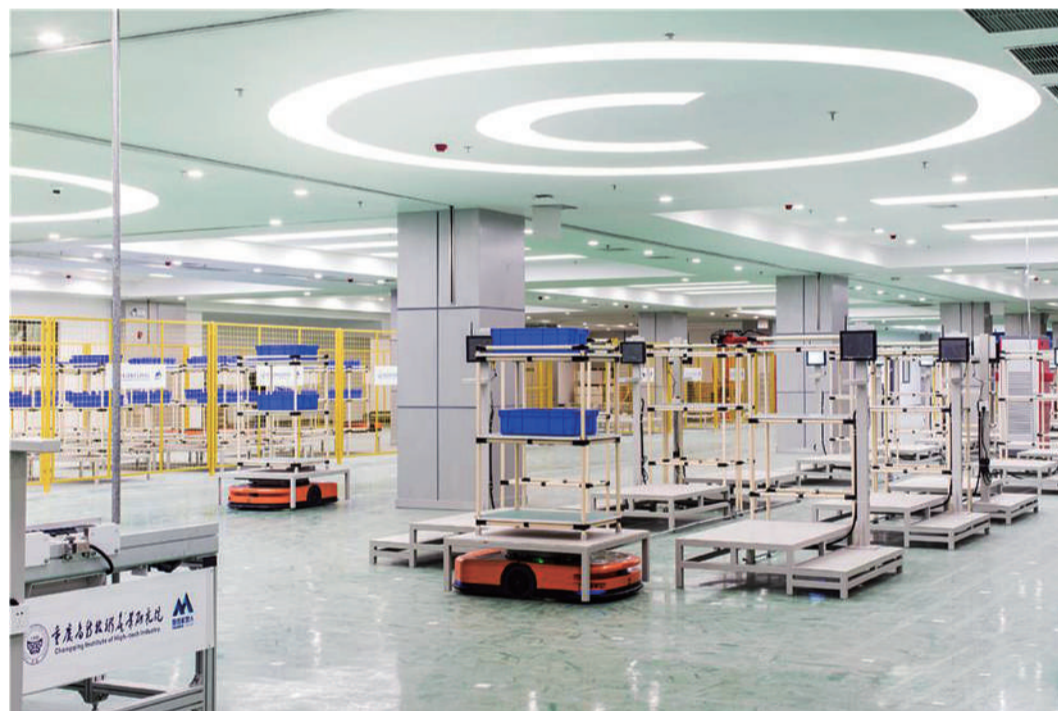
图为西部(重庆)科学城璧山创新生态社区内的全自动化生产车间。

2021年,川渝两地滚动安排合作共建重大项目67个。截至6月底,已开工58个,完成年度投